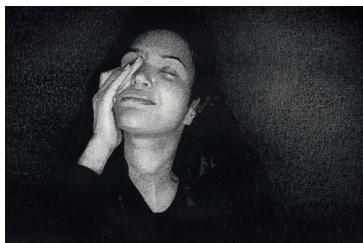
Thomas Lévy-Lasne, Distanciel Chiraz , 2023 Fusain sur papier, 40 x 60 cm