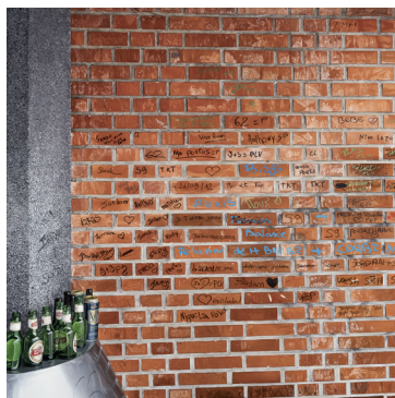
Thomas Lévy-Lasne, Le mur de Lens , 2023 Huile sur toile, 120 x 120 cm