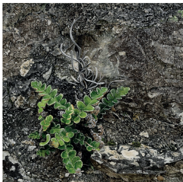
Thomas Lévy-Lasne, Plante saxicole , 2022 Huile sur toile, 25 x 25 cm