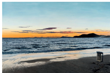
Thomas Lévy-Lasne, La plage d'Hyères , 2023 Huile sur toile, 130 x 195 cm