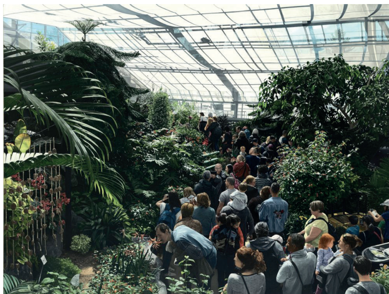
Thomas Lévy-Lasne, Dans la serre , 2020-23, Huile sur toile, 150 x 200 cm