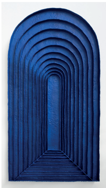
Levi van Veluw, Perception , 2024 Polymer clay, metal frame, 170 x 86 cm