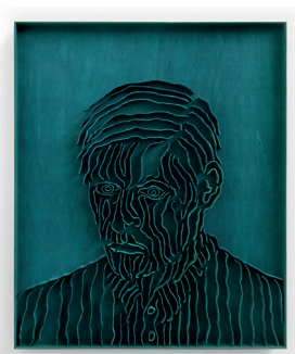
Levi van Veluw, Insistent , 2023 Wood, ink, metal frame, 91 x 76 cm