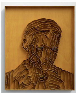
Levi van Veluw, Consent , 2023 Wood, ink, metal frame, 91 x 76 cm