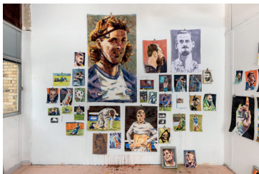
Louis Verret, Les fruits de la passion , 2021