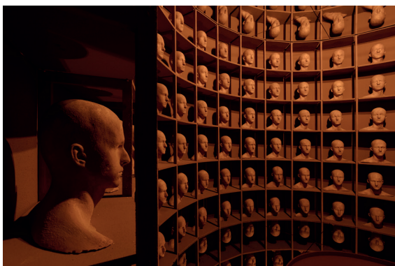
Levi van Veluw, In the Depths of Memory , 2023 Installation, Mixed materials, 430 x 290 cm