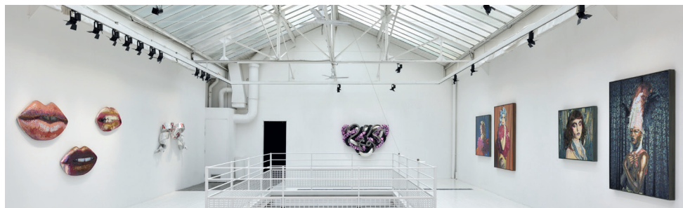
RUE DES FILLES-DU-CALVAIRE