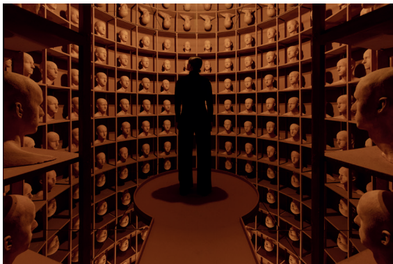
Levi van Veluw, In the Depths of Memory , 2023 Installation, Mixed materials, 430 x 290 cm