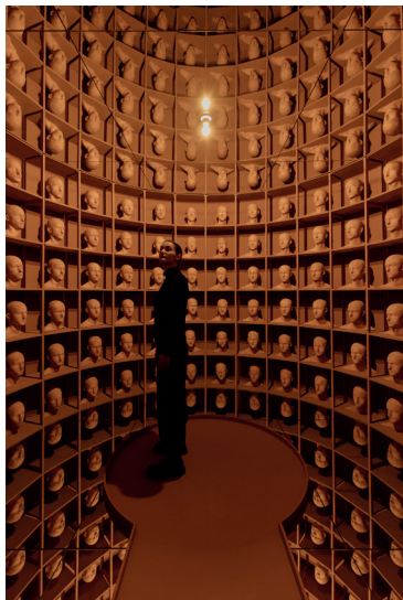
Levi van Veluw, In the Depths of Memory , 2023 Installation, Mixed materials, 430 x 290 cm