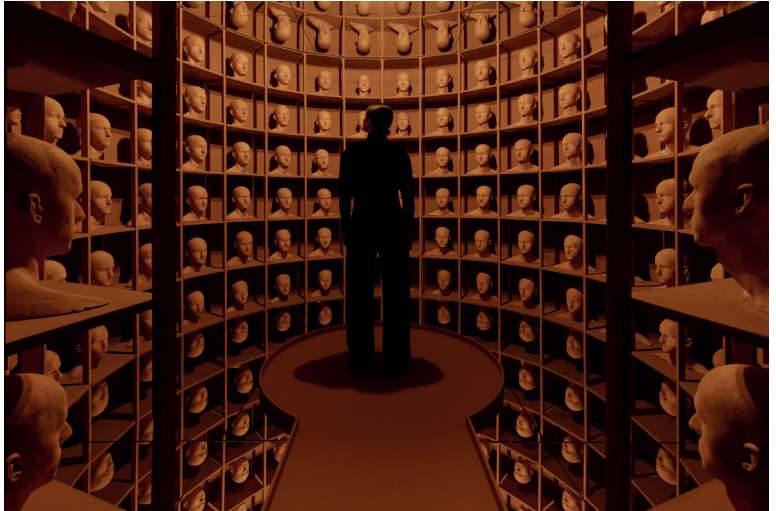
Levi van Veluw, In the Depths of Memory , 2023, Installation, Mixed materials, 430 x 290 cm © Michèle Margot

EXPOSITION DU 2 MAI AU 8 JUIN 2024 VERNISSAGE JEUDI 2 MAI (18H - 21H) 17 RUE DES FILLES DU CALVAIRE