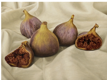
Jérémie Cosimi, Les figues , 2024