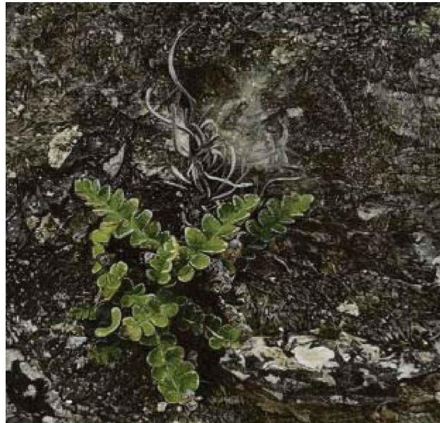
Plante saxicole (2022).