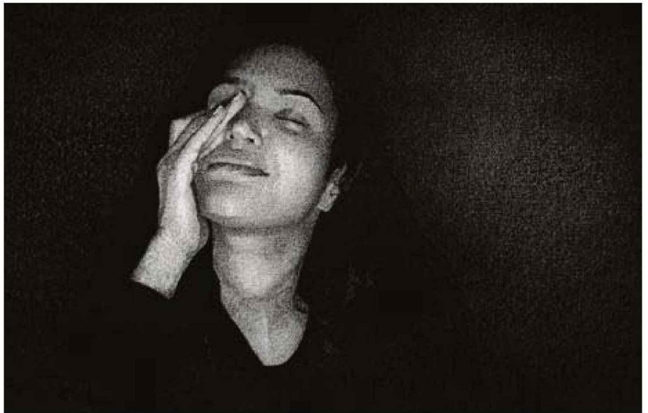
Distanciel Chiraz (2023).