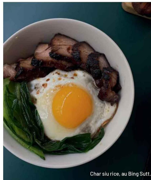
Char siu rice, au Bing Sutt.