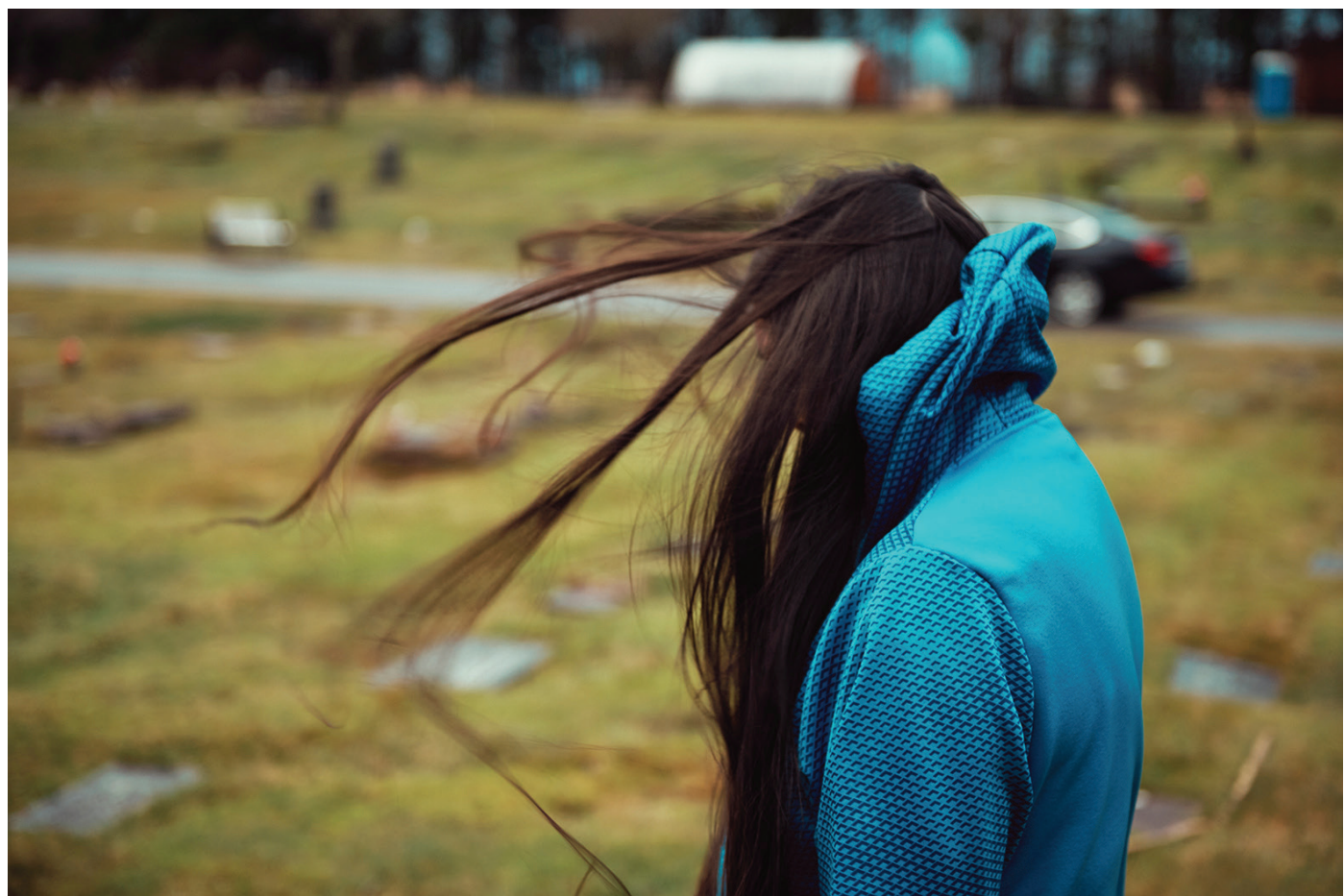
Kourteny Roy, Vicki at the graveyard , 2018 Series The Other End of the Rainbow