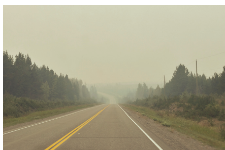
Kourtney Roy The road I, 2018 Series The Other End of the Rainbow

La galerie a le plaisir d'annoncer The Other End of the Rainbow , une exposition personnelle de l'artiste canadienne Kourtney Roy. La photographe reconnue pour la créativité de ses mondes fictionnels, aborde avec ce travail un sujet grave : depuis plus de quarante ans, le long de la Highway 16, une route du nord de la Colombie Britannique, disparaissent des femmes et jeunes filles pour la plupart originaires des Premières Nations.