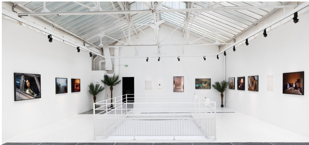
RUE DES FILLES-DU-CALVAIRE