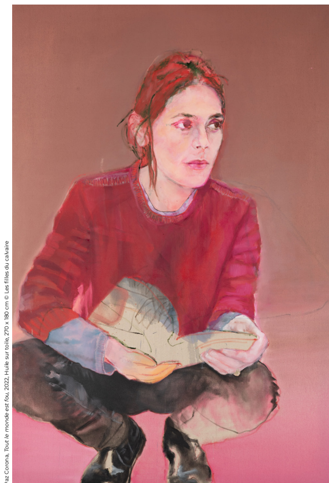
Paz Corona, Tout le monde est fou, 2022, Huile sur toile, 270 x 180 cm

« FIXION » (X, lettre qui indexe l'inconnu et aussi l'existence)