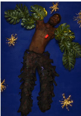
Maya Inès Touam, Icare, le revenant , 2020, Tirage jet d'encre, 170 x 120 cm © Les filles du calvaire

A partir de différents supports (photographies, dessins et sculptures), Maya Inès Touam entreprend un travail à la fois anthropologique et onirique, à partir d'objets symboliques et personnels. Elle plonge dans ses racines, qu'elle interroge et fouille pour tirer, de ces fragments d'histoire, des images - souvent des natures mortes.