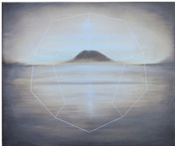
Mirage/dodécaèdre/élément ether Acrylique et huile sur toile 2012.

« Le premier contact avec l'œuvre d'Édouard Wolton est un vertige. Entre identité esthétique forte et motifs hétéroclites, entre délice plastique et démarche conceptuelle rigoureuse, entre hommage à la rationalité et dérive mystique, l'art oxymore de ce jeune peintre joue et se joue des contradictions inhérentes à la question de la représentation. Revendiquant la relation nécessaire de toutes ces oppositions, sa création navigue en eaux