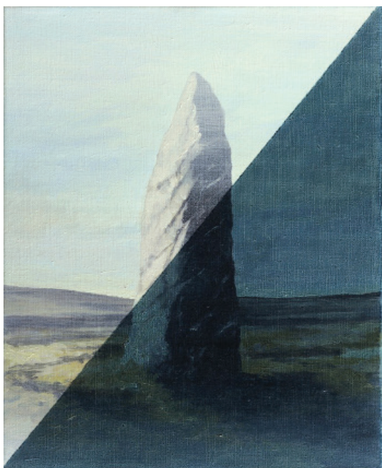
Menhir jour/nuite , 2013 Acrylique et huile sur toile

1 er vernissage le jeudi 3 septembre de 18h à 21h 2 nd vernissage le samedi 10 octobre de 15h à 20h