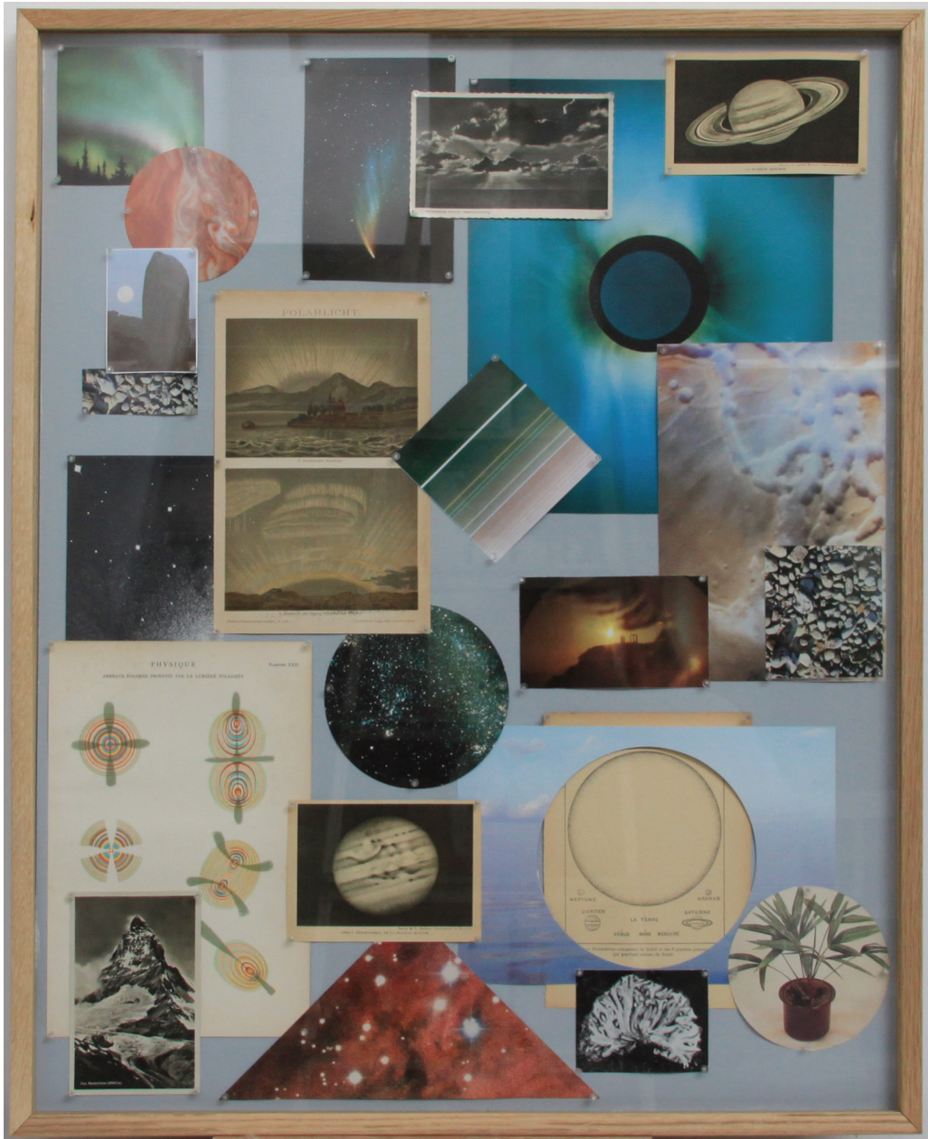
Bibliothécaire #3 , 2013. Estampes, documents, photographies, épingles, sous cadre