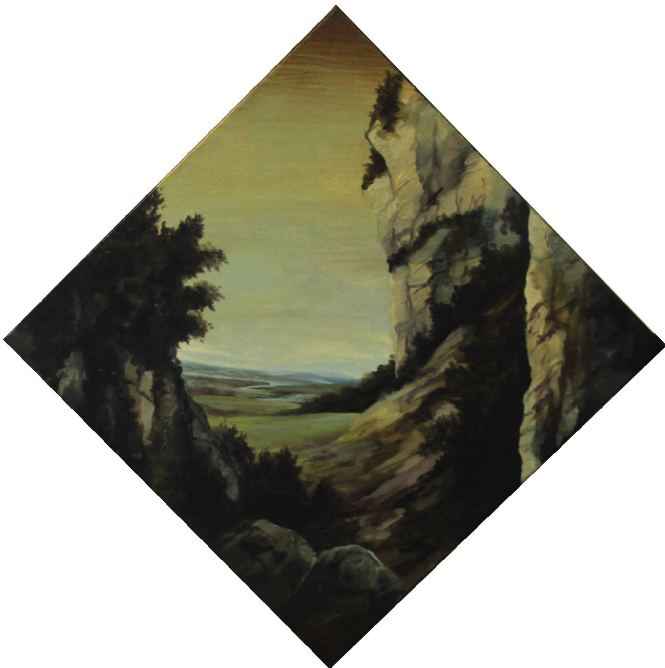
Carré italien , 2012. Acrylique et huile sur toile