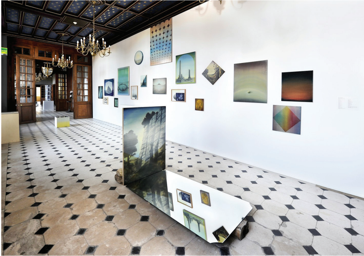
Vue d'exposition, «Vues» au Domaine de Chamarande, 2014