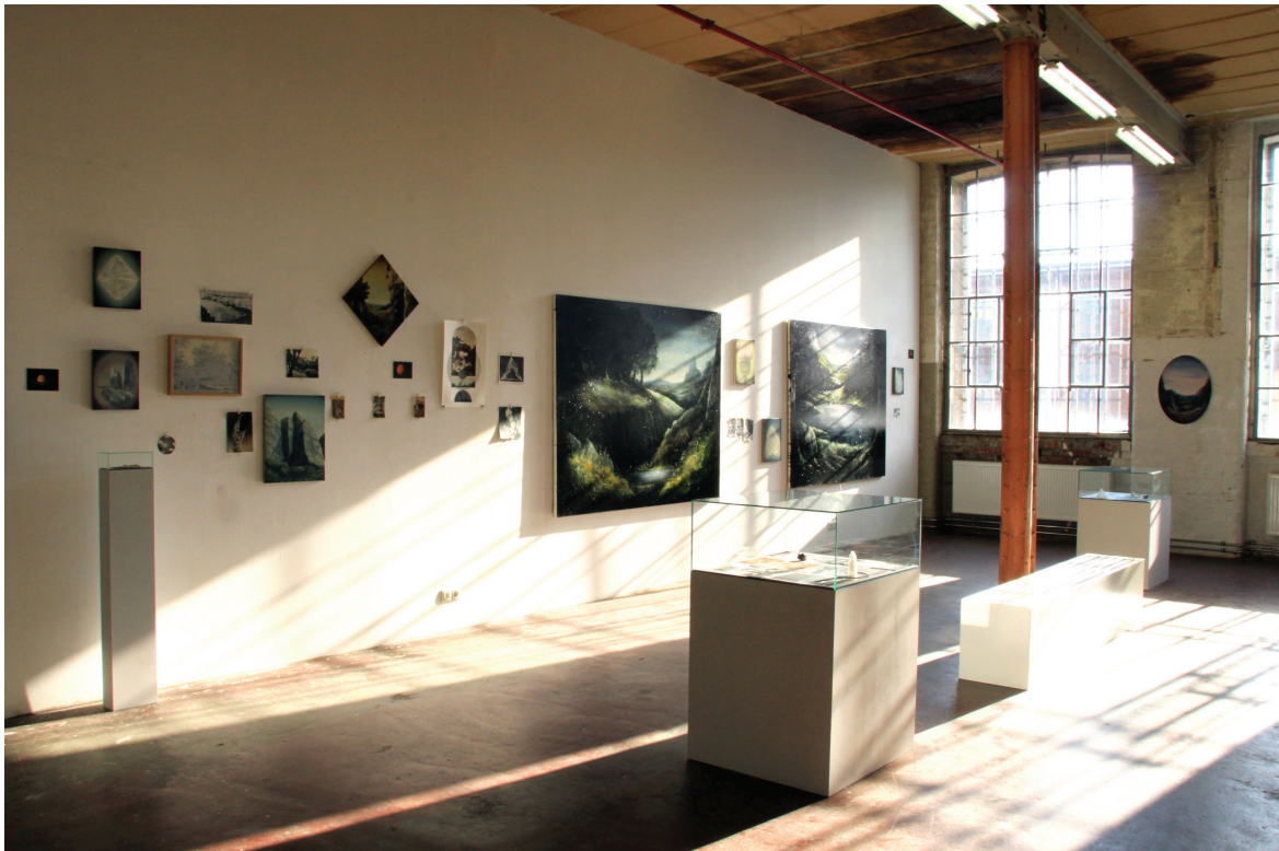
Vue d'exposition, «Geometrie der Natur» Spinnerei, Leipzig Allemagne, 2012