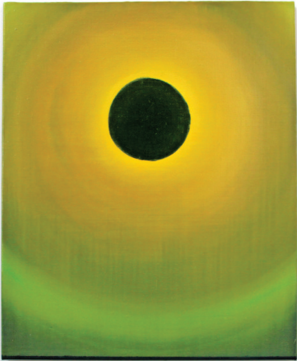
Eclipse , 2013. Acrylique et huile sur toile