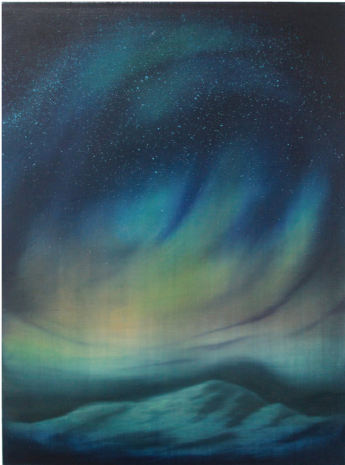
Aurore boréale , 2014 Acrylique et huile sur toile