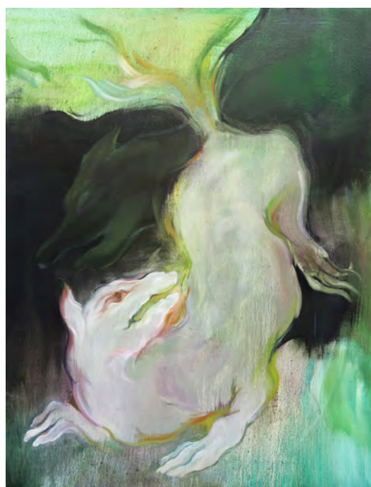
Makiko Furuichi, Cache cache , 2025. Huile sur toile, 100 x 75 cm Makiko Furuichi, Sous la pluie , 2025. Huile sur toile, 100 x 75 cm