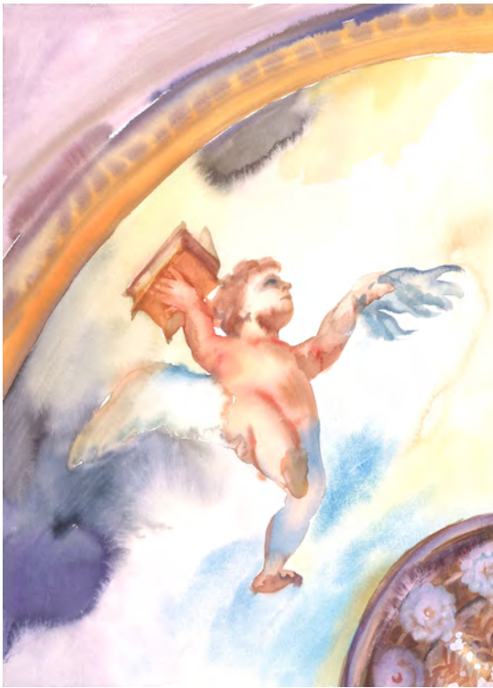
Makiko Furuichi, Ange , 2023. Aquarelle sur papier, 30 x 40 cm