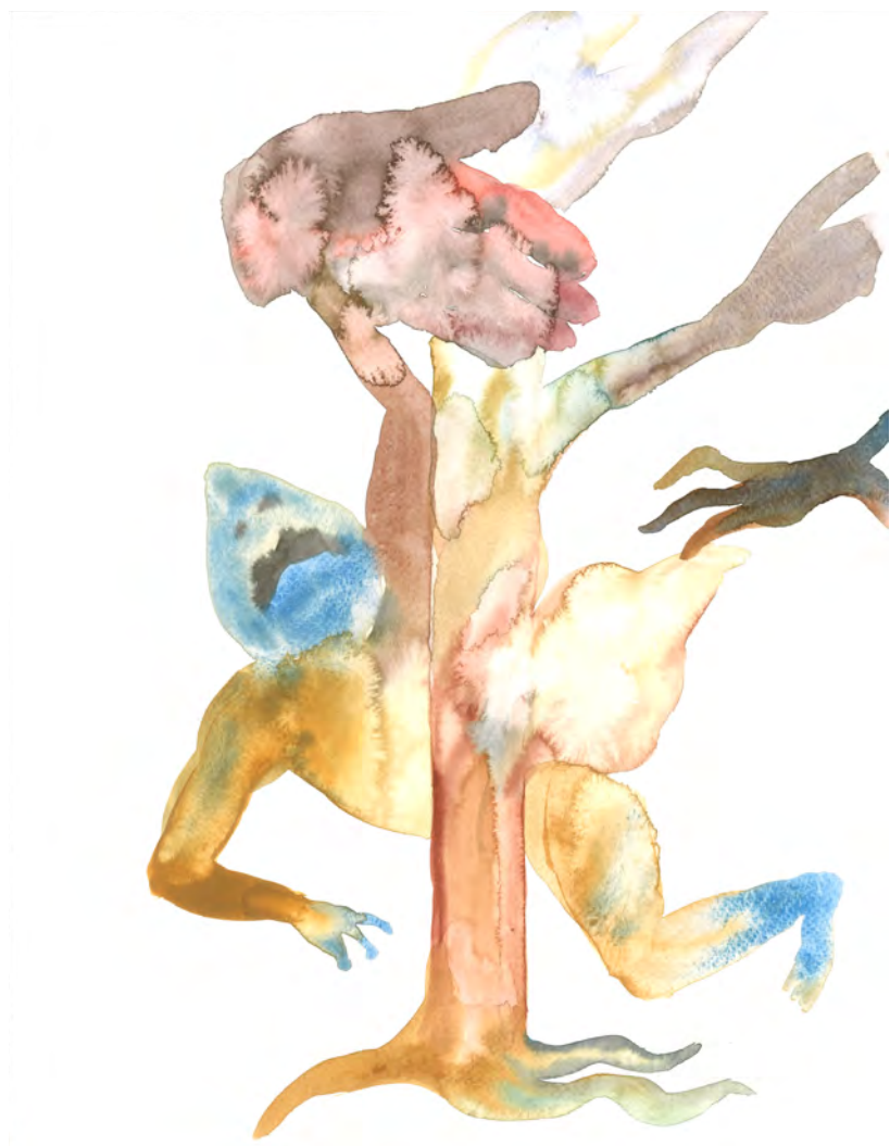
Makiko Furuichi, Trésor , 2021. Aquarelle sur papier, 30 x 40 cm