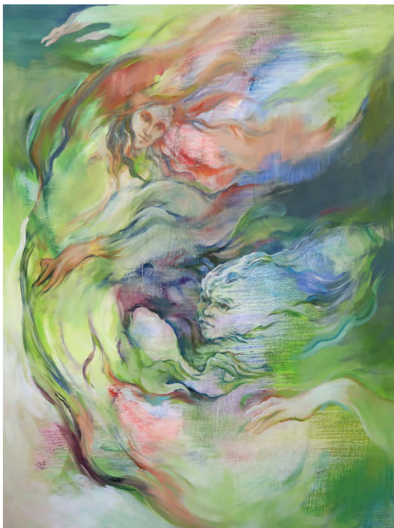
Makiko Furuichi, Histoire d'amour du vent , 2025. Huile sur toile, 200 x 150 cm