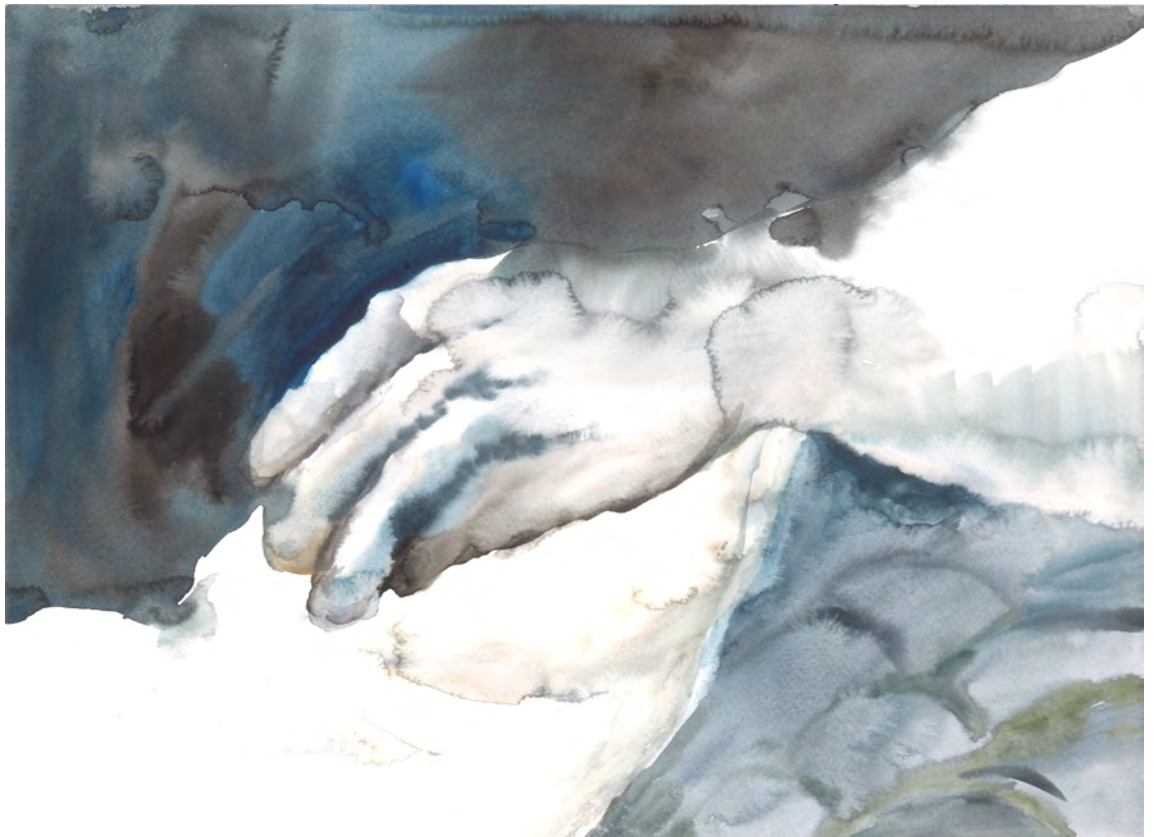
Makiko Furuichi, Grande et chaude , 2023. Aquarelle sur papier, 30 x 40 cm

Les anges et les Yokai ne sont pas des figures rassurantes, mais des présences mystérieuses, symbolisant la fragilité de la vie et l'invisible qui nous entoure. Ils incarnent cette frontière floue entre le vivant et l'esprit, entre le monde matériel et l'au-delà. L'exposition nous invite à réfléchir à la mort non seulement comme une séparation, mais comme une expérience commune qui modifie notre perception du monde.