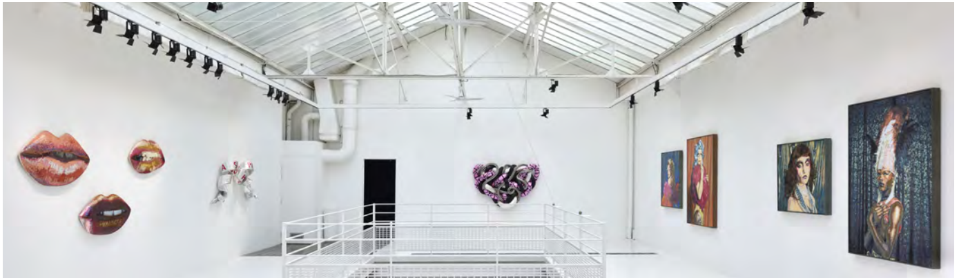
RUE DES FILLES-DU-CALVAIRE