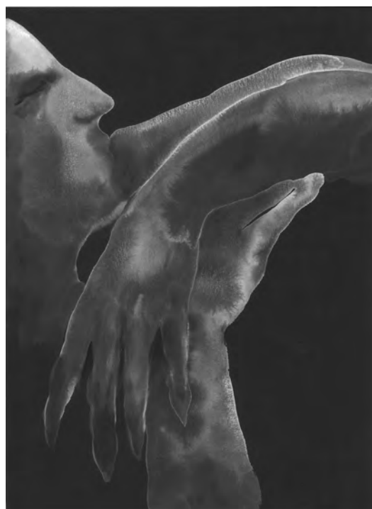
Makiko Furuichi, Nuit , 2023. Aquarelle sur papier, 28 x 38 cm Makiko Furuichi, Sans titre , 2023. Aquarelle sur papier, 30 x 42 cm