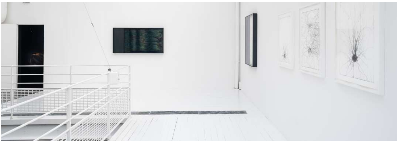
RUE DES FILLES-DU-CALVAIRE