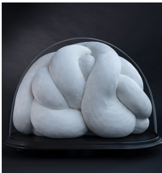
Kate MccGwire, NUZZLE , 2024. Technique mixte avec plumes d'oie dans un dôme en verre antique, 45 x 60 x 20 cm