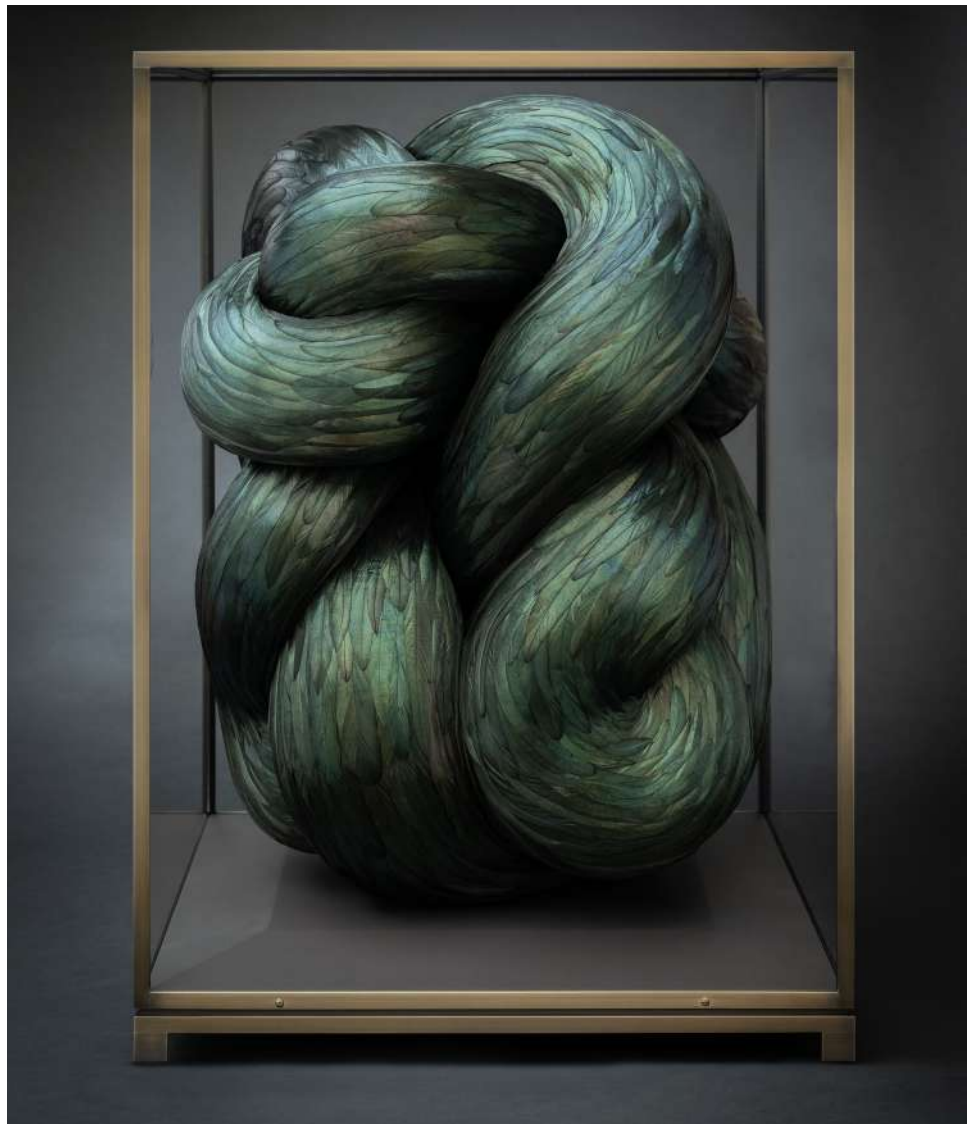
Kate MccGwire, TORSION , 2024. Technique mixte avec plumes de coq, 76.6 x 55 x 55 cm

En bousculant subtilement l'ordre naturel, cette exposition remet en question le statu quo. MccGwire vous invite à découvrir un univers sensuel et ambigu, vous laissant perplexe sur la véritable nature de ce que vous contemplez.