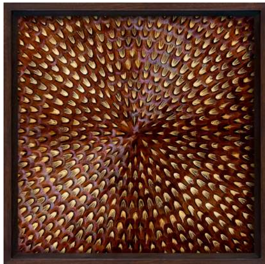
Kate MccGwire, THROB , 2023. Technique mixte avec plumes de faisan, 46.5 x 46.5 x 6 cm