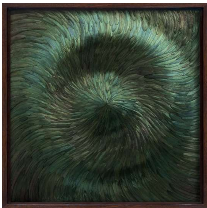
Kate MccGwire, MAELSTROM (Spring) , 2024. Technique mixte avec plumes de coq, 80 x 80 x 1.2 cm