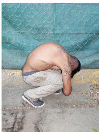
Antoine d'Agata Central de Abastos , Mexique, 2021