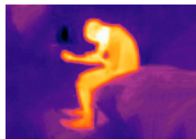
Antoine d'Agata Narcothermic , Mexique, 2017