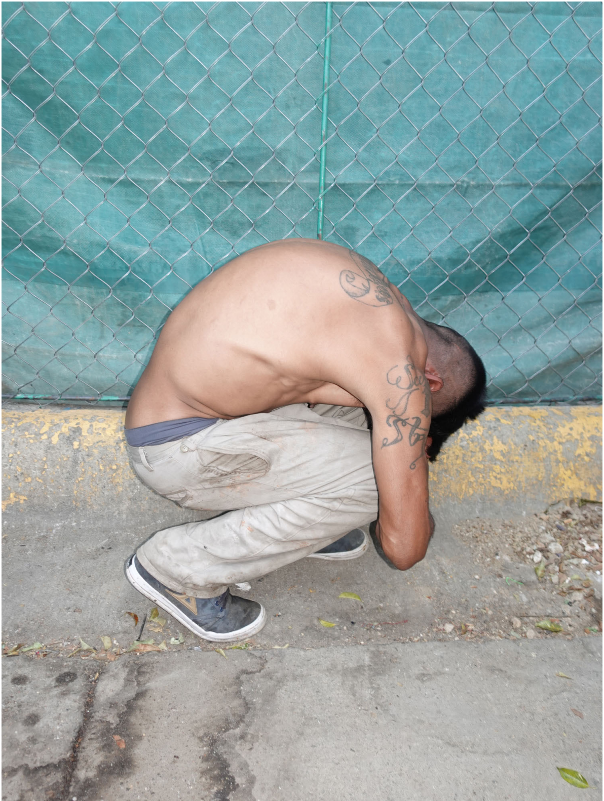
Antoine d'Agata Central de Abastos, Mexique, 2021