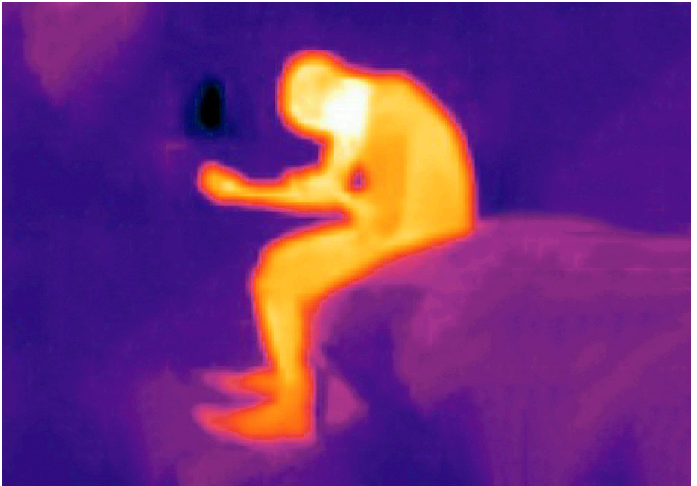
Antoine d'Agata Narcothermic , Mexique, 2017 Courtesy Galerie Les filles du calvaire