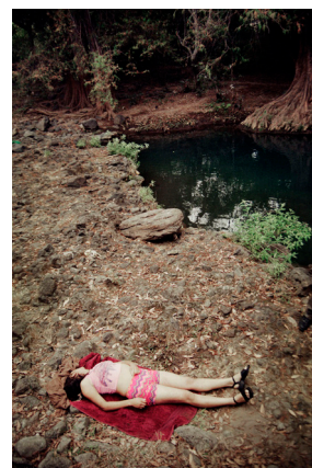
Los últimos hombres, Mexique, 2016