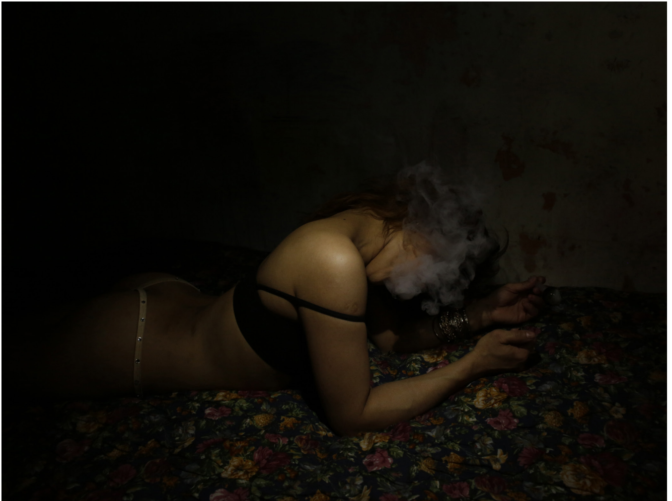
Antoine d'Agata Crystal Tijuana, 2019