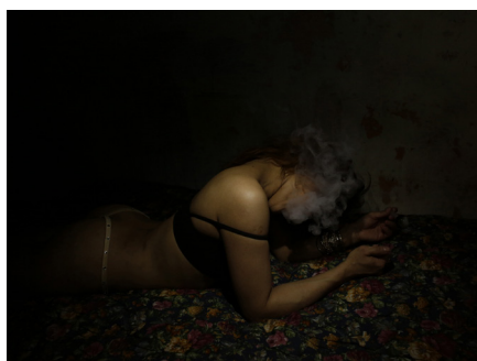
Antoine d'Agata Crystal Tijuana , 2019