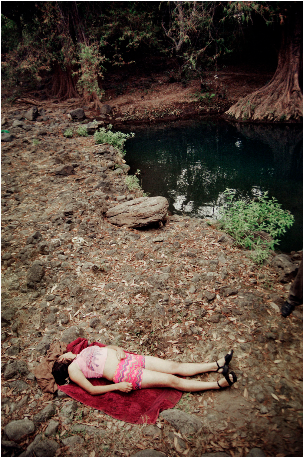
Los últimos hombres, Mexique, 2016