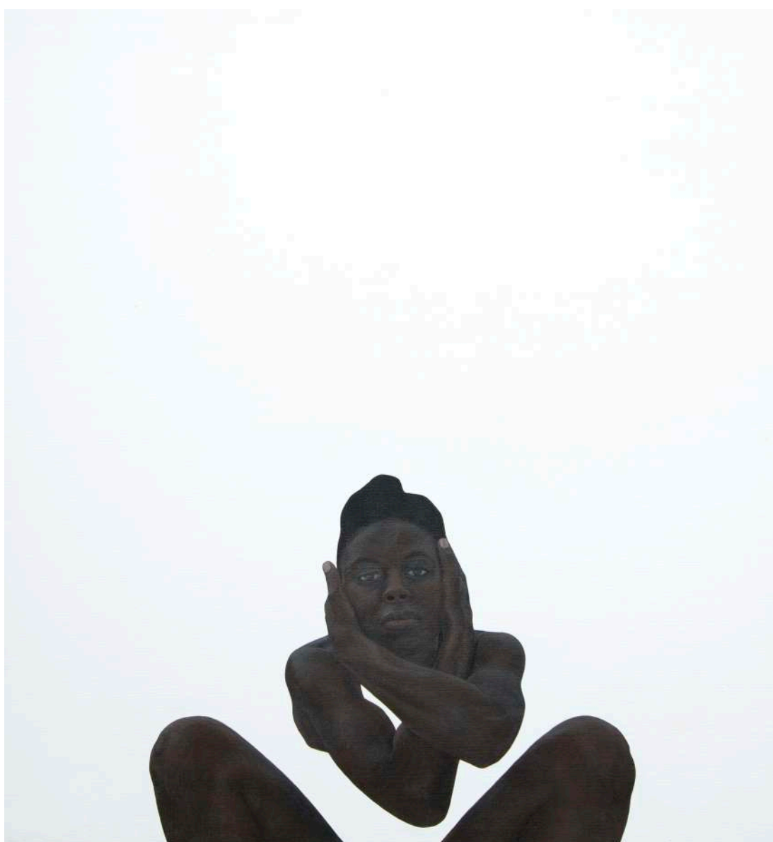
Sungi Mlengeya, Pendo , 2026. Acrylique sur toile, 140 x 150 cm. © Sungi Mlengeya, Courtesy of Les filles du calvaire, Afriart Gallery and the artist

17 RUE DES FILLES-DU-CALVAIRE, 75003 PARIS