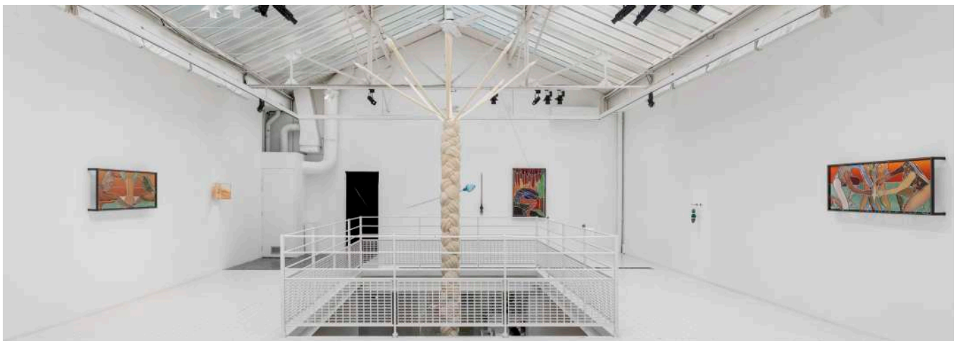
RUE DES FILLES-DU-CALVAIRE