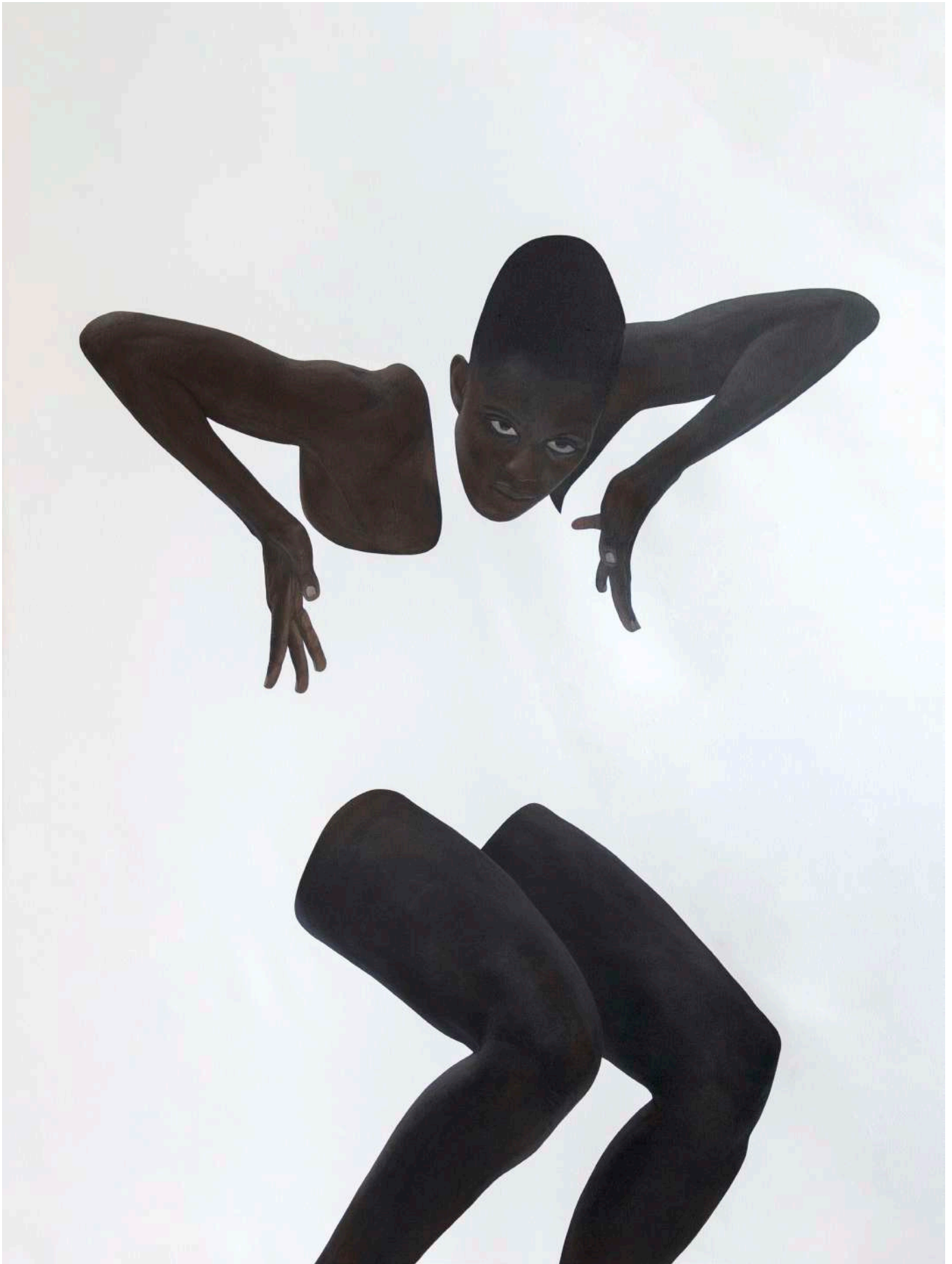
Sungi Mlengeya, From below , 2026. Acrylique sur toile, 200 x 150 cm.