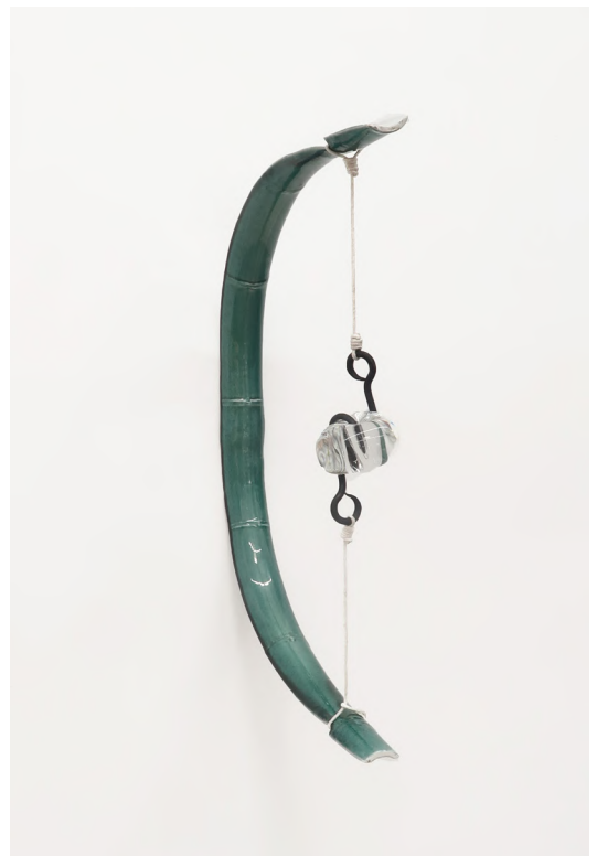
Zhuo Qi, Balancing Ball , 2026. Sculpture en verre soufflé, 70 x 45 x 10 cm.