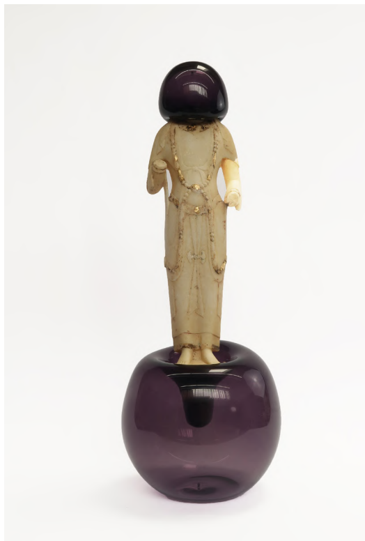
Zhuo Qi, Bubble-Game , 2026. Sculpture en pierre et verre soufflé, 41 x 20 x 20 cm.

Plus qu'un simple panorama d'une série d'œuvres, l'exposition construit un espace à partir de trois ensembles structurellement liés, autour du fragment, du fardeau et des mécanismes de défense. Ensemble, ces œuvres répondent à la question centrale posée par le titre : ce que nous ne pouvons empêcher peut-il malgré tout être déplacé et réinscrit ailleurs ?