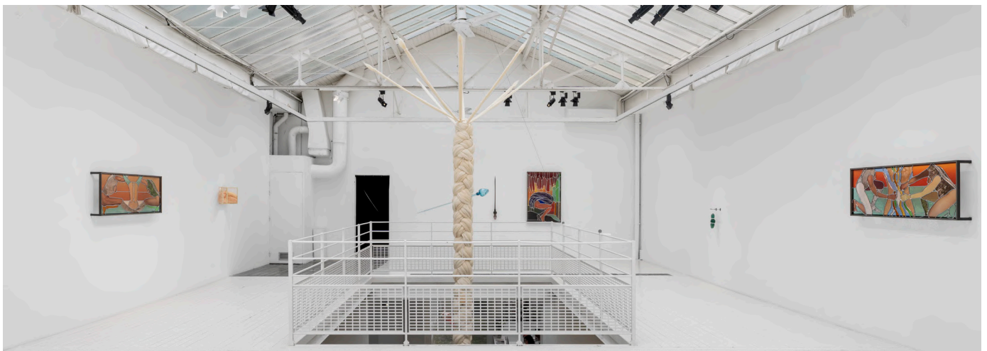
RUE DES FILLES-DU-CALVAIRE