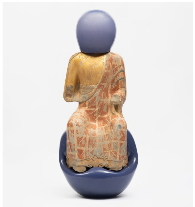
Zhuo Qi, Bubble-Game , 2026. Sculpture en pierre et verre soufflé, 94 x 40 x 40 cm.

En regard de Bubble Game , l'exposition présente une grande installation en forme de colonne composée de Mohele et de moules de jouets pour enfants. Le Mohele renvoie à l'origine aux traditions populaires, aux fêtes, aux vœux et aux figures enfantines, tandis que les moules de jouets évoquent la réplique, le jeu, l'enfance et les systèmes modernes de production. Zhuo Qi organise ces éléments sous la forme d'une structure située entre colonne votive, vestige archéologique, tour de jouets et architecture pseudo-religieuse. Elle semble provenir d'une civilisation qui n'aurait jamais existé : une civilisation qui vénérerait le fragment, la répétition, le malentendu et les formes inachevées. Chaque moule y est à la fois une coquille vide et un outil destiné à produire des images ; il conserve le négatif d'un corps tout en suggérant un rituel de reproduction sans fin.