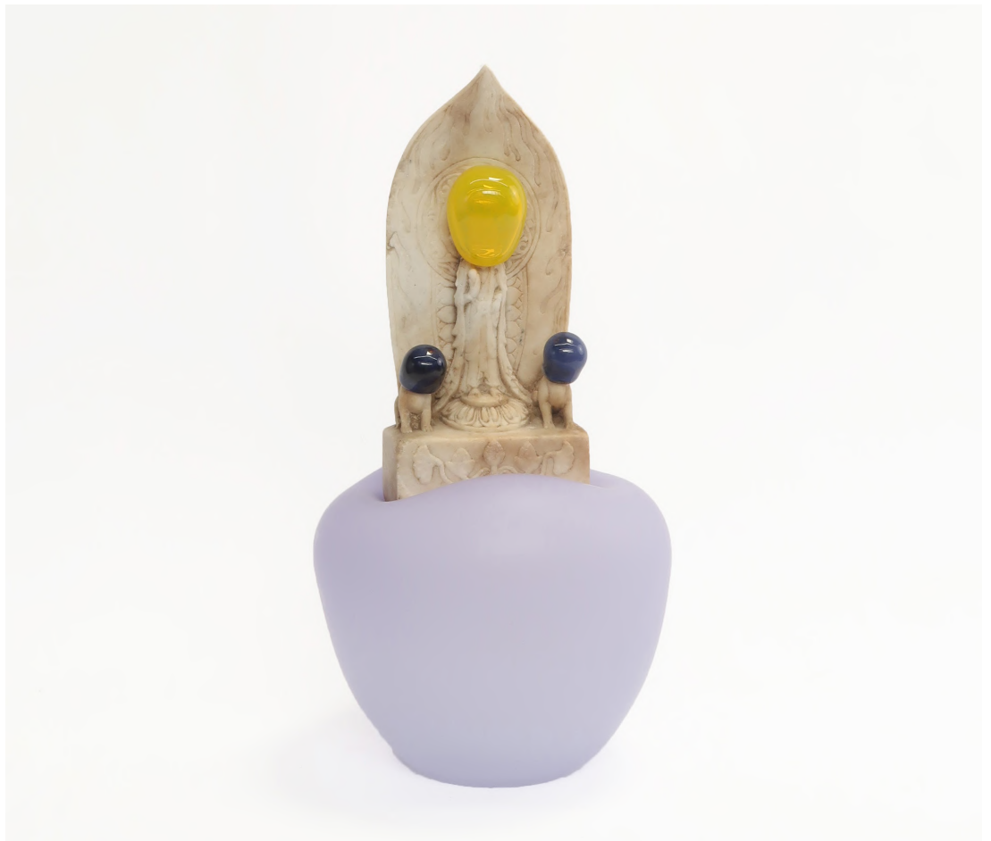
Zhuo Qi, Bubble-Game , 2026. Sculpture en pierre et verre soufflé, 41 x 20 x 20 cm.

Du 5 septembre au 24 octobre 2026, l'artiste Zhuo Qi présentera à la galerie Les filles du calvaire sa nouvelle exposition personnelle : On ne peut empêcher les oiseaux de malheur de voler au-dessus de nos têtes, mais peut-être pouvons-nous les empêcher d'y faire leur nid . Ce titre s'inspire d'une formule proverbiale chinoise largement répandue. Pour Zhuo Qi, cette phrase ne relève pas d'une consolation psychologique ; elle fonctionne plutôt comme une méthode de travail appliquée aux matériaux, à l'histoire et au corps.