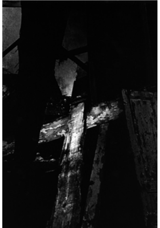
Sans titre #04, série Loaded Shine, 2008-13