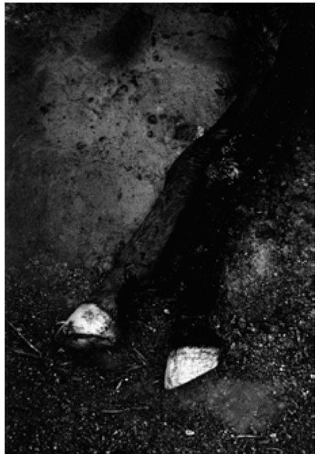
Sans titre #05, série Loaded Shine, 2008-13