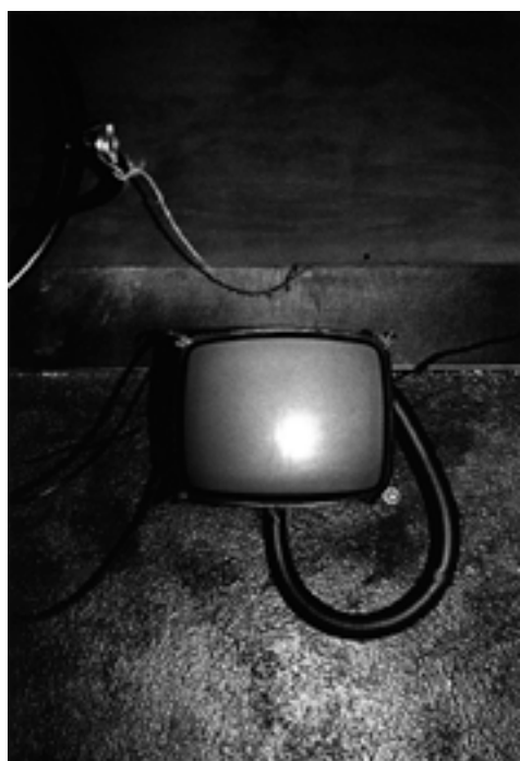
Sans titre #18, série Loaded Shine, 2008-13

Vernissage Samedi 10 mars 2018 de 15h à 19h