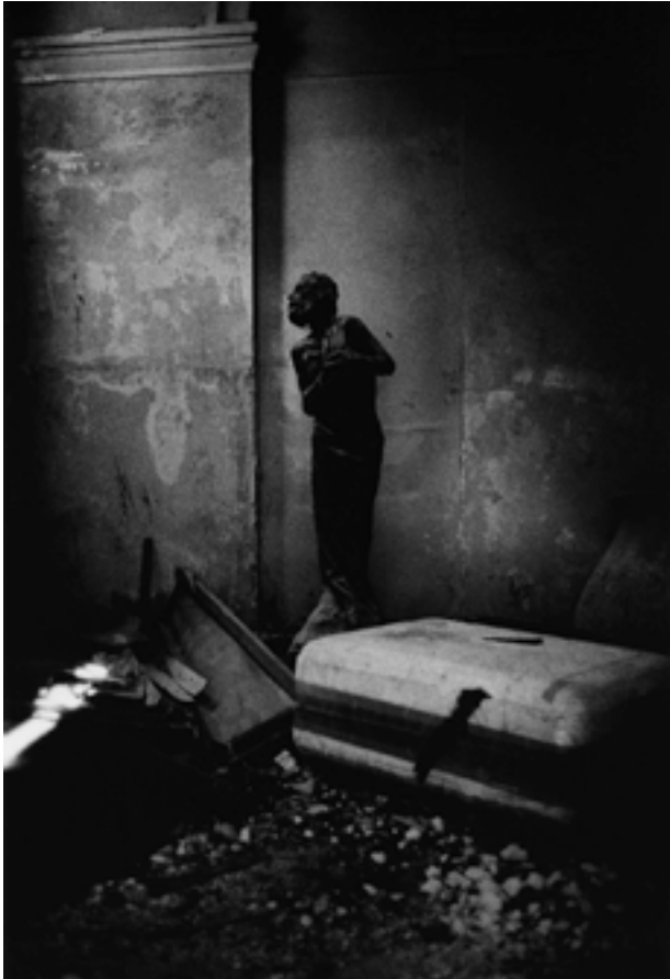
Sans titre #02, série Loaded Shine, 2008-13