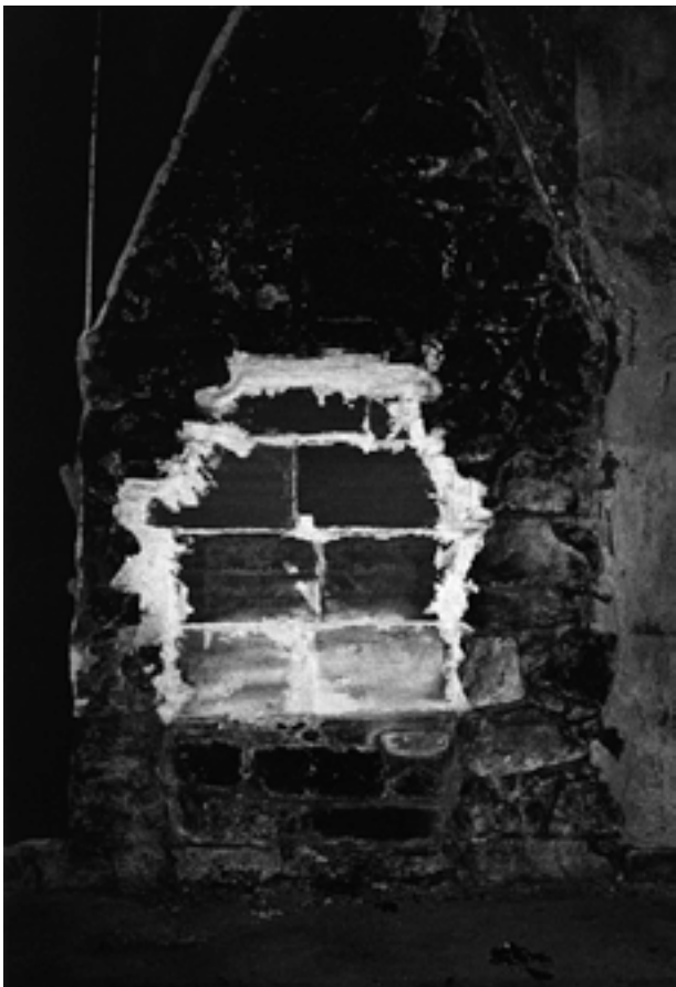
Sans titre #08, série Loaded Shine, 2008-13