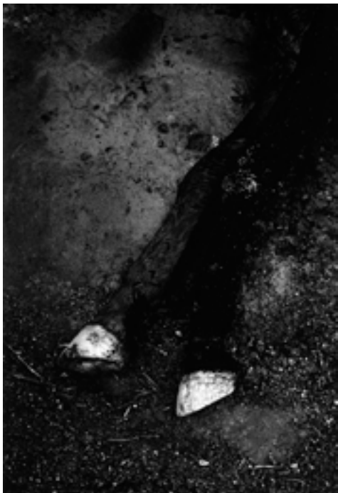
Sans titre #05, série Loaded Shine, 2008-13

Paulo Nozolino est un fervent contemplatif et le plus souvent cette attitude lui sert à épurer l'image. Il photographie pour isoler et simplifier. Avec Loaded Shine, cette épuration s'opère par un arrêt sur le motif, une pause dans le noir. Parce qu'il prend son temps, son œil reconnaît la charge symbolique et poétique des objets et des situations. Le talent est là, il dépasse la première impression et l'apriori pour en redéfinir les codes d'appréciation. Derrière ces objets oubliés, il est bien question de disparition mais c'est aussi surtout le refus du grandiose, l'apologie du quotidien, du banal et du pauvre. Une même lumière éclaire donc, sans distinction, la croix et les sabots d'un animal mort. Le sublime et le sacré semblent dès lors d'une étonnante simplicité, il suffit de regarder.