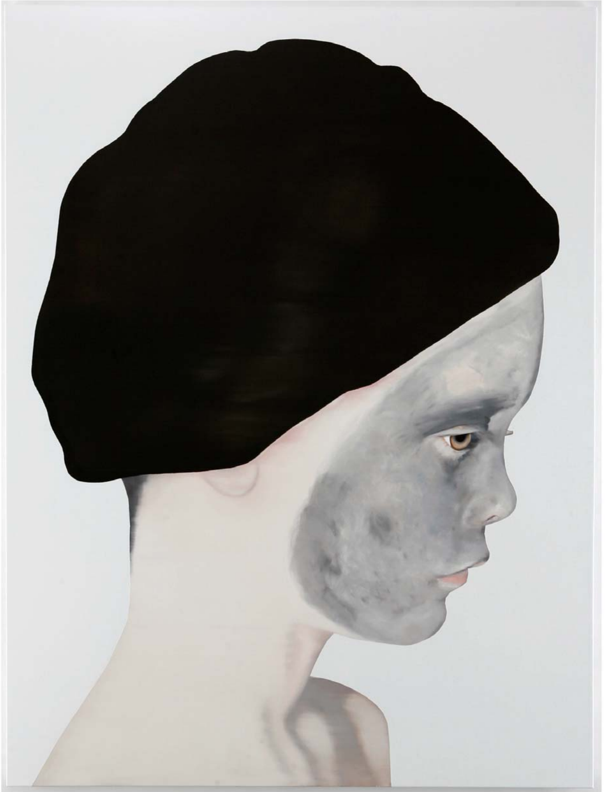
Sans titre, 2006, huile sur toile, 240 x 180 cm