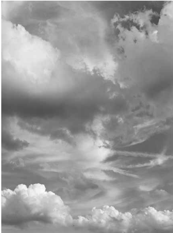
Clouds #89, New York City, 2015

“ J'ai choisi les nuages comme une opposition aux rochers. Je pensais confronter le temps ancien et le temps contemporain.