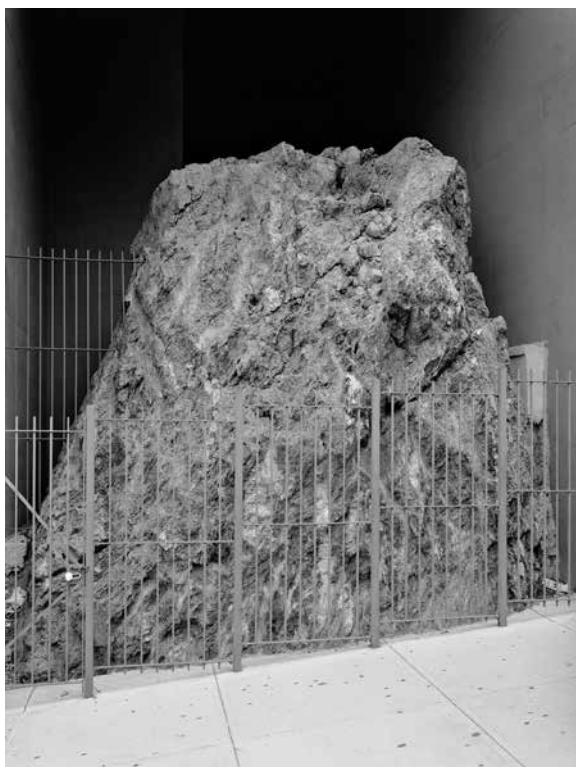
East 172nd Street, Bronx, 2014

urbaine forment une énergie qui n'échappe pas non plus à Mitch Epstein. Bien qu'il place son regard sur ce créneau de contradictions, ces photographies transcendent la simple opposition entre nature et culture en laissant le choc du sublime intervenir ou non. Au-delà de Central Park, c'est la ville entière de New York et ses Boroughs qui devient le terrain d'une réelle entreprise de cartographie, scandée par les trois motifs. L'efficacité du noir et blanc (nouveau dans son travail), tout comme l'infinité des gris, accentuent la vigueur formelle et insoupçonnée des motifs choisis: les mers de nuages, le branchage audacieux des arbres ou les strates anarchiques de la roche.