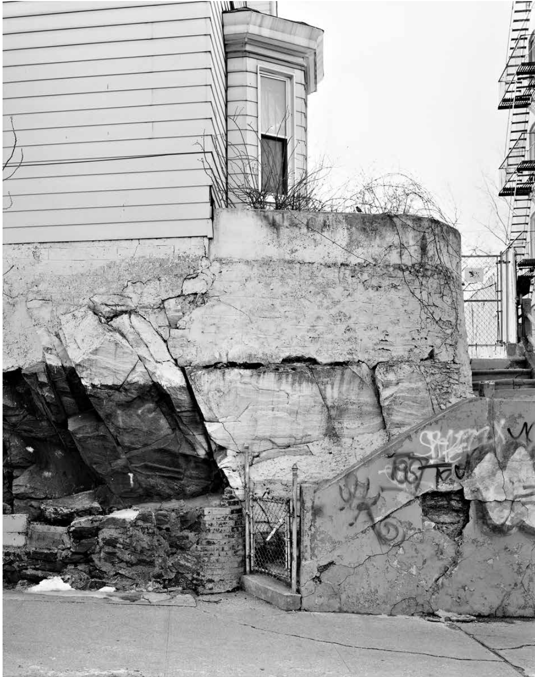
Marion Avenue, Bronx, 2015