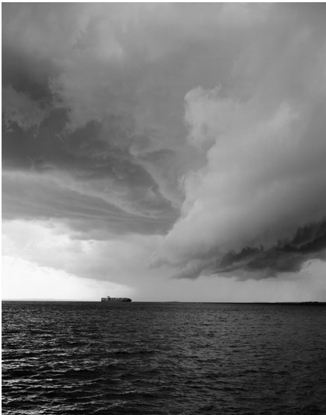
Clouds #94, New York City, 2015