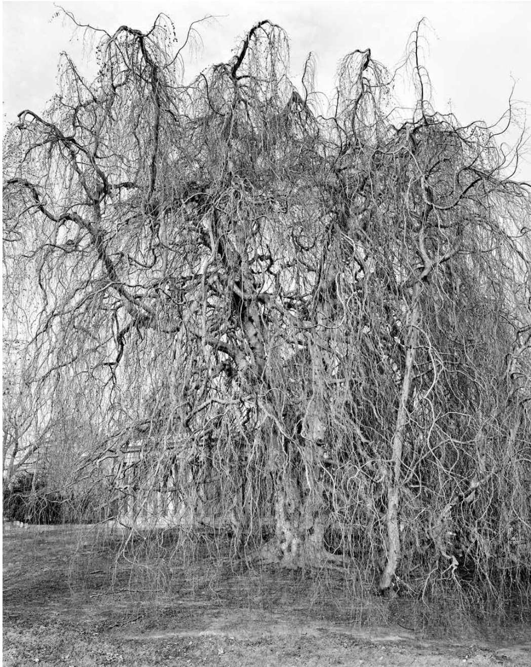
Weeping Beech, Woodlawn Cemetery, Bronx, 2012