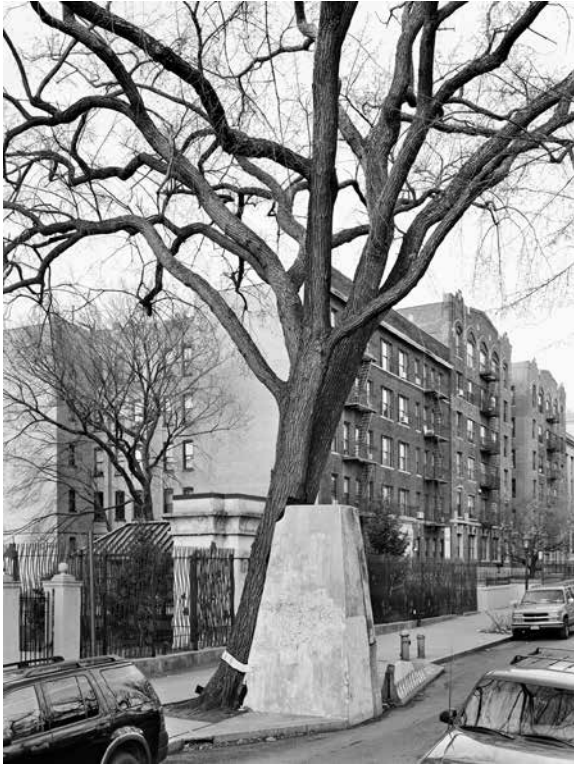
American Elm, Eastern Parkway, Brooklyn, 2012

Mitch Epstein compte parmi les photographes américains les plus importants de sa génération. Cinq ans après son exposition American Power à la Fondation Cartier Bresson il revient à Paris, à la galerie Les filles du calvaire, avec une trilogie d'ampleur présentée pour la première fois en France : New York Trees, Rocks & Clouds .