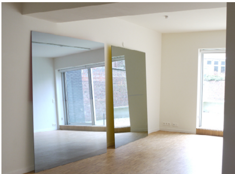
Pierre Toby, Wilde 1 , Huile sur verre, 205 x 170 cm pièce