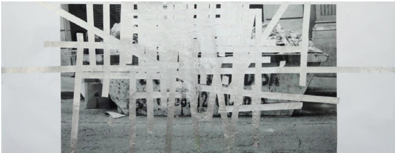
John Beech, Tape Drawing [Berlin] , 2012, Ruban adhésif métallisé, photographie noir & blanc, 122 x 244 cm