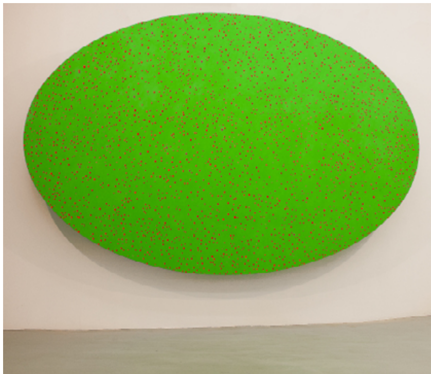
Didier Mencoboni, O , 2015, Acrylique sur toile, 450 x 280 cm, Courtesy Galerie Eric Dupont