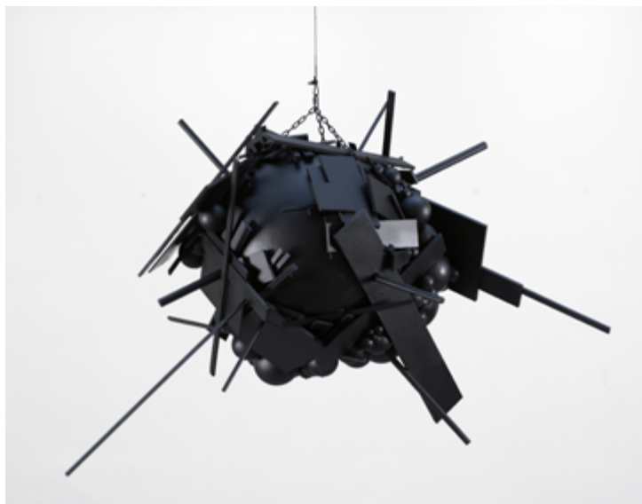
Emmanuelle Villard, « Akira » OV-70.01, 2007 Bois, polystyrène, laque, sphère de 70cm, envergure de 150 cm

Il est membre de la Commission Consultative des Arts Plastiques (CCAP) du Ministère de la Fédération Wallonie-Bruxelles, depuis 2007 (Bruxelles).