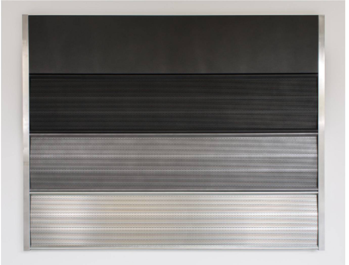
Xavier Mary, Foster , 2014, Brushed anti noise panels, poly mirror, textured metallic powder, brushed aluminum profile, 240 x 300 x 12,5 cm, Courtesy Galerie Albert Baronian