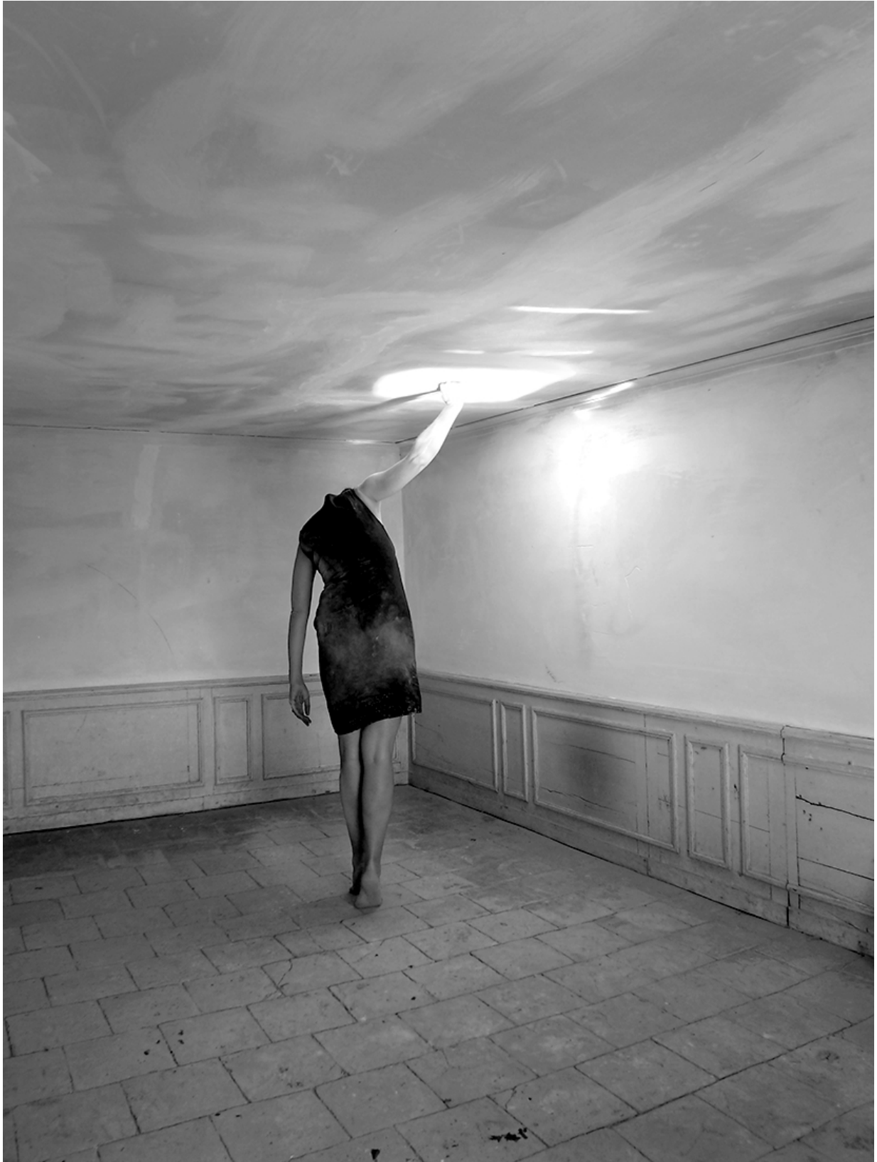
Tout contre , 2008-2014