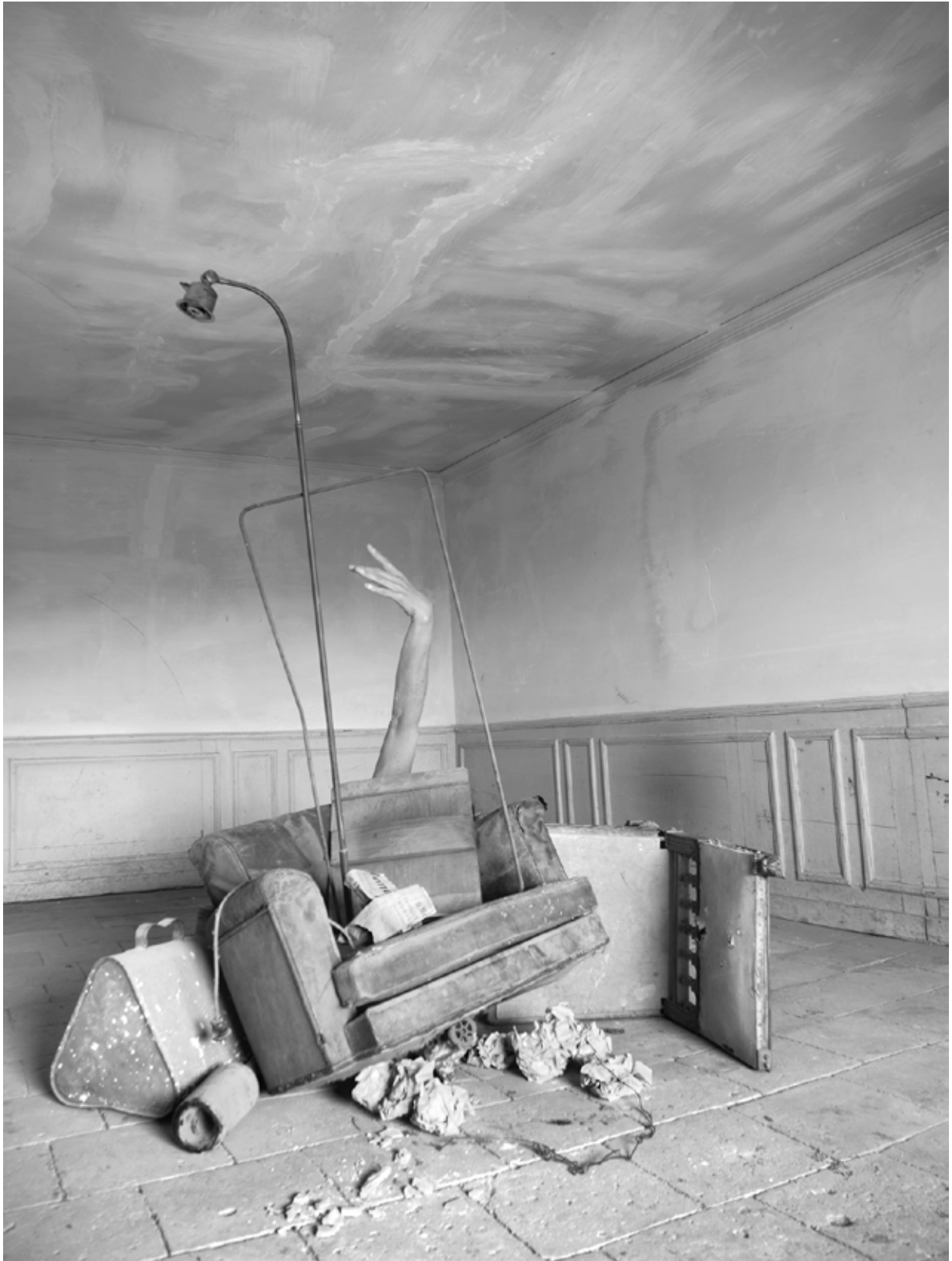
Tout contre , 2008-2014