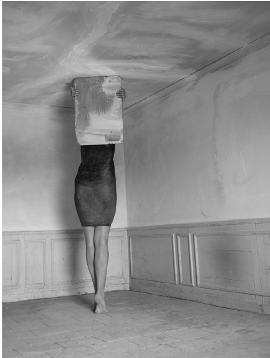
Tout contre , 2008-2014