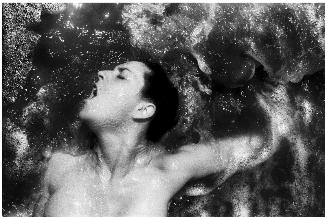
Yusuf Sevinçli, Série « Deauville », 2018.