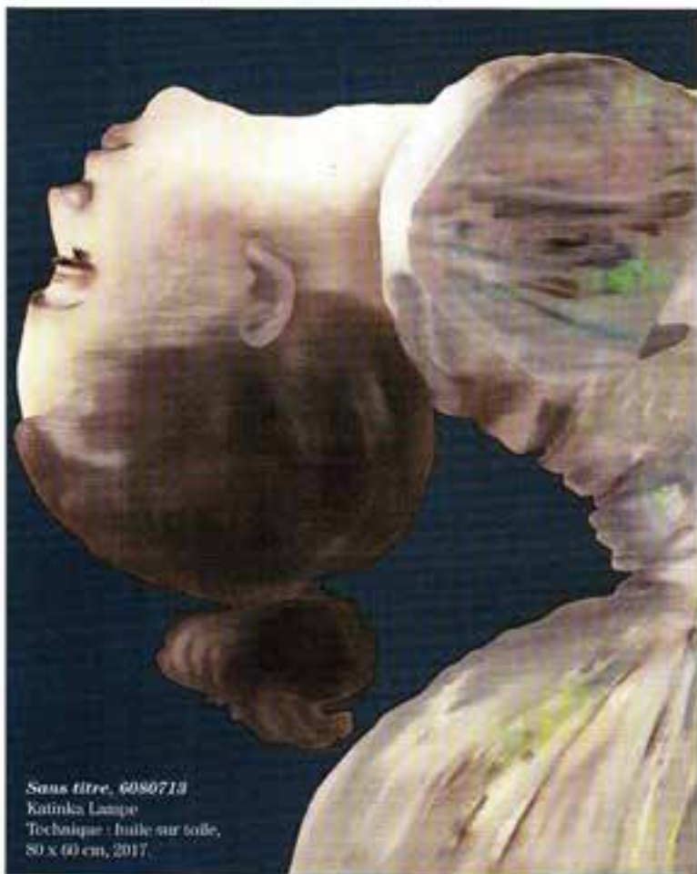
Sans titre, 6080713 Katinka Lampe Technique : huile sur toile, 80 x 60 cm, 2017.