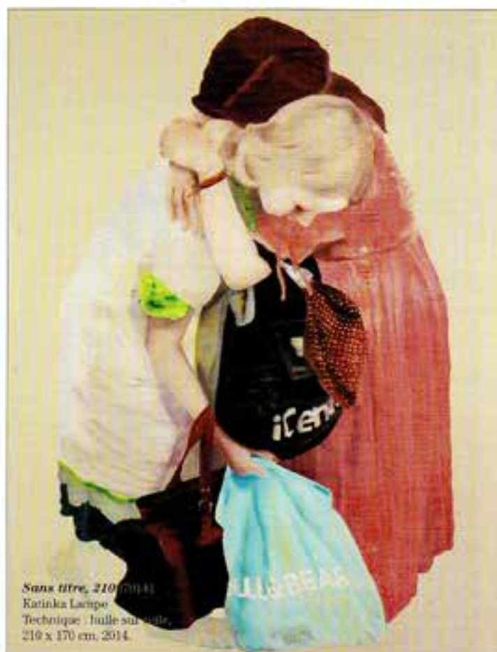
Sans titre, 2014 Katinka Lampe Technique : huile sur toile 210 x 170 cm, 2014