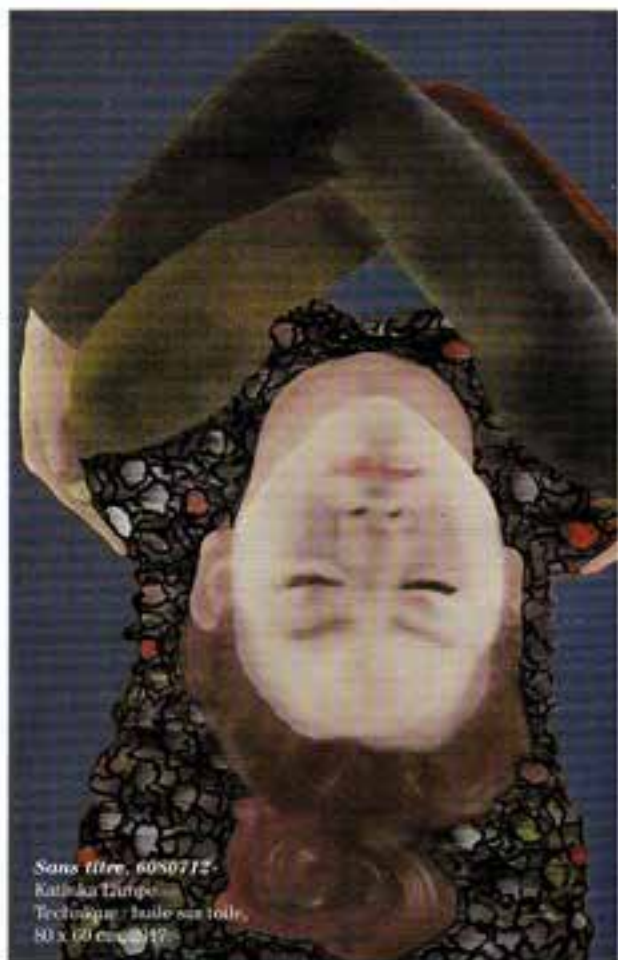
Sans titre, 6080712 Katinka Lampe Technique : huile sur toile, 80 x 60 cm, 2017.