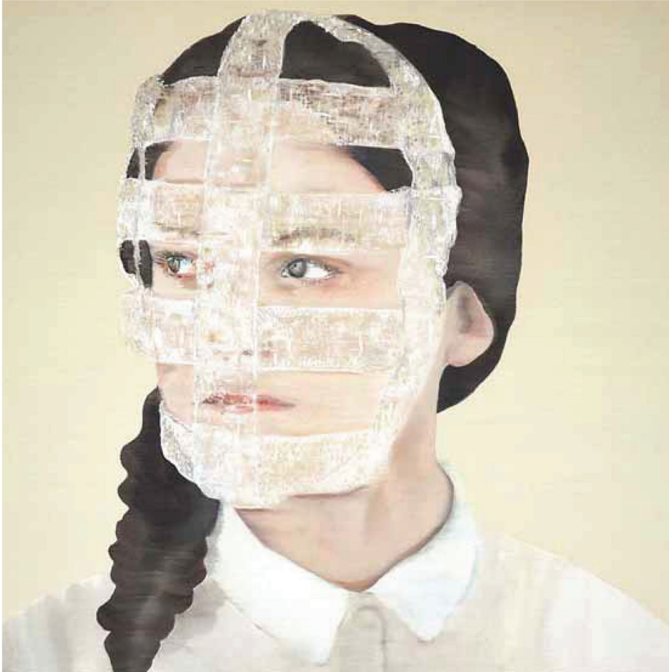
links Katinka Lampe, '600152', 2015. Olieverf op doek, 60 x 60 cm. Collectie Cathy Wills Collection, London.