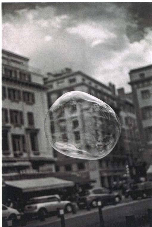
Sans titre, N°010, série Marseille, 2013, tirage pigmentaire.