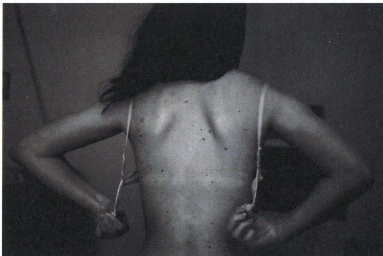
Ci-dessus: Yusuf Sevinçli, Good Dog , 2006, tirage pigmentaire.

À seulement 35 ans, Yusuf Sevinçli fait l'objet d'une rétrospective à La Filature de Mulhouse. Rencontre avec le photographe ture qui monte.