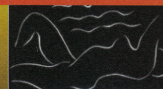
Matisse et la gravure, l'autr... Le Cateau-Cambrésis