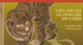
Tigres de papier, cinq siècl... Paris