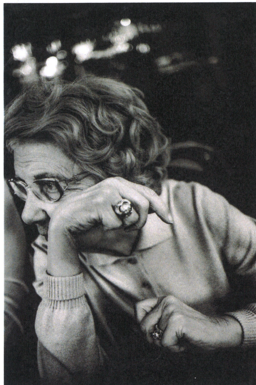
Sans titre N°021, série Vichy, 2015, tirage pigmentaire.