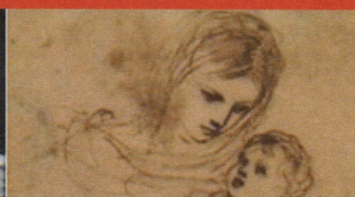
La Fabrique de l'œuvre : de... Angers