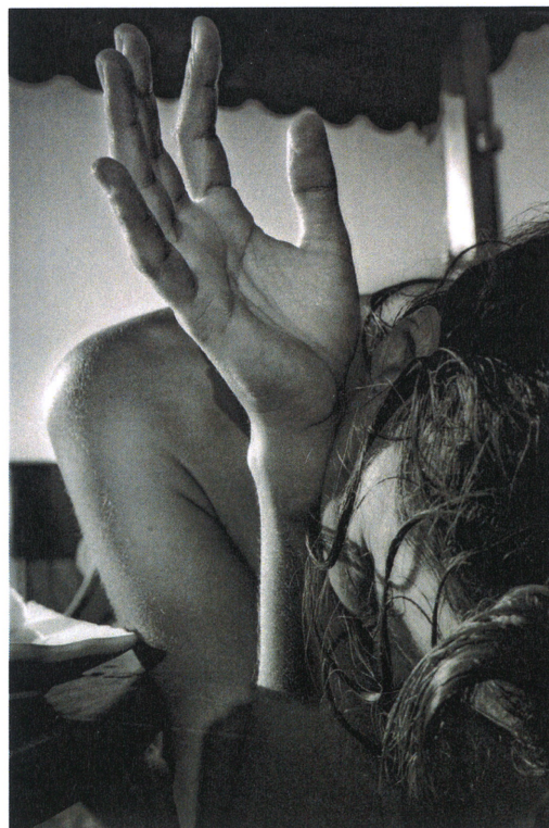
Sans titre, N°016, série Post II, tirage pigmentaire.