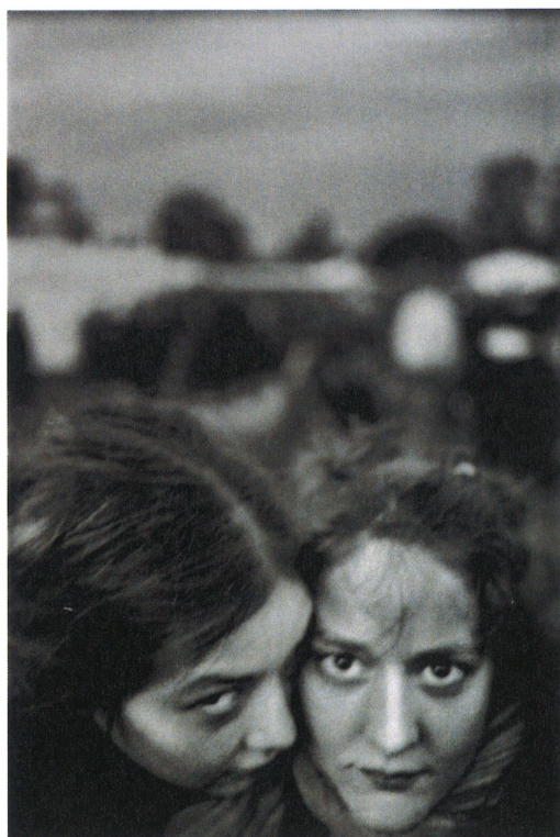
Good Dog, 2006, tirage pigmentaire.