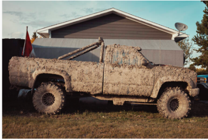
A Fraser Lake, en Colombie-Britannique. (Kourtney Roy)