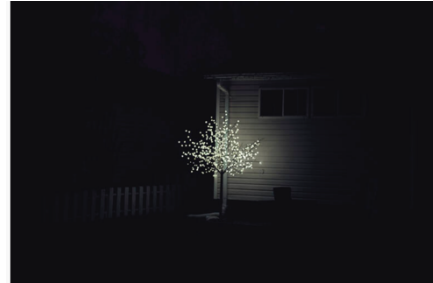
Près de Fraser Lake. (Kourtney Roy)