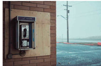
A Houston, en Colombie-Britannique. «Un client du restaurant m'a dit : "On fait pas de la soupe de poulet avec de la merde de poulet."»