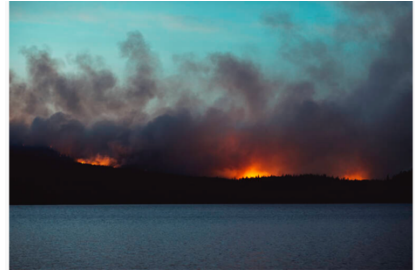
«L'incendie de Shovel Lake embrasait les arbres comme des allumettes, le ciel réfléchissait la tempête merdique et magique qui se déroulait sous mes yeux.» (Kourtney Roy)