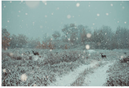
Près de Fraser Lake. (Kourtney Roy)