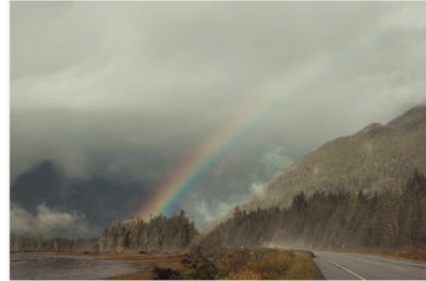
«Depuis mon dernier voyage, en 2019, on a retrouvé dans la région les corps d'au moins quatre autres femmes. Les femmes et les jeunes filles incluses dans ce livre représentent seulement une faible fraction du nombre réel des gens disparus ou assassinés dans cette région.» (Kourtney Roy)