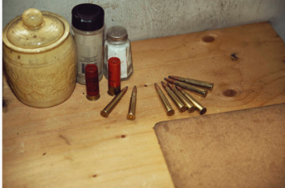
Dans ce travail documentaire, Kourtney Roy livre aussi à la première personne les impressions de son voyage : «L'épuisement et la paranoïa se disputaient le contrôle de mon cerveau.» (Kourtney Roy)