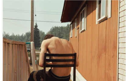
«J'ai dormi dans ma voiture garée sur un parc de mobile homes, fréquenté par les ours et les dealers de drogue.» (Kourtney Roy)