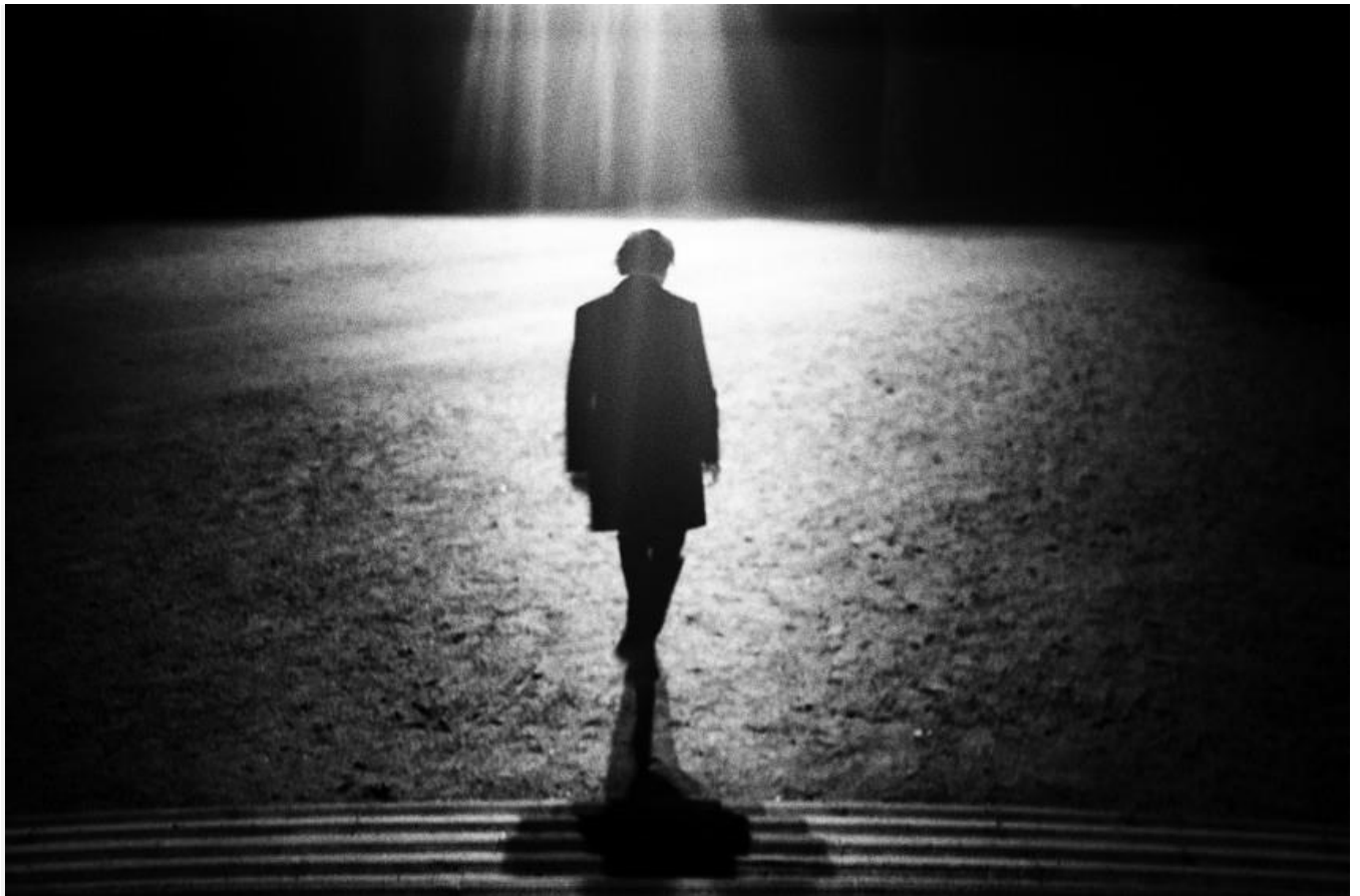
Sans Titre #11, série Vichy, 2015