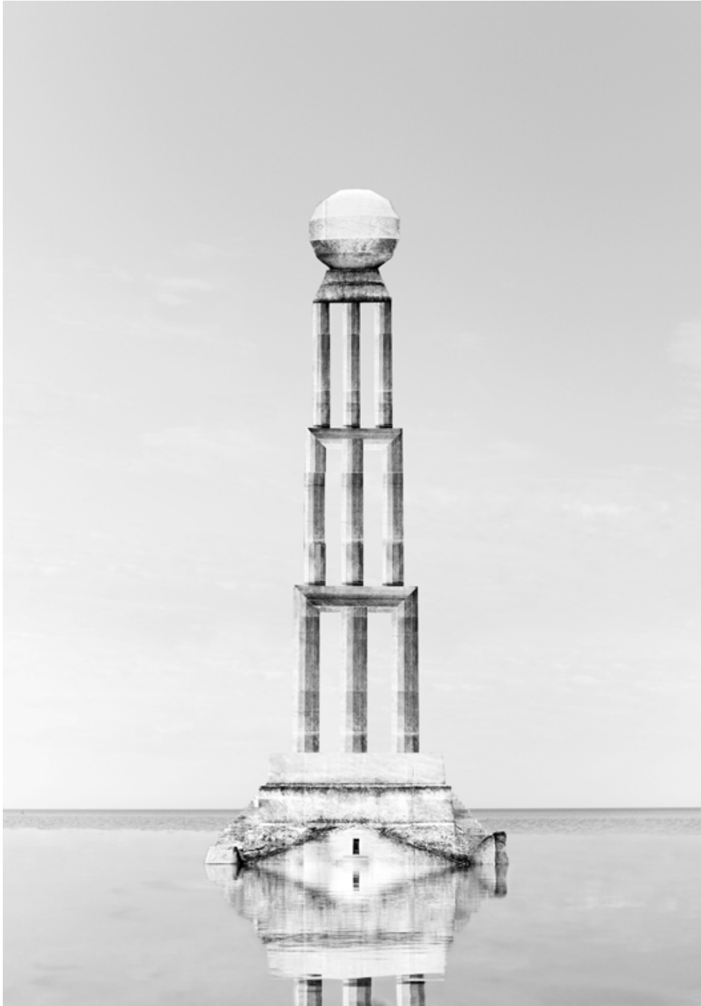
Noémie Goudal Tower I , 2015