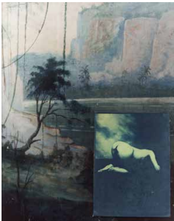
Esther Teichmann Untitled, from Fractal Scars, Salt Water and Tears, 2015