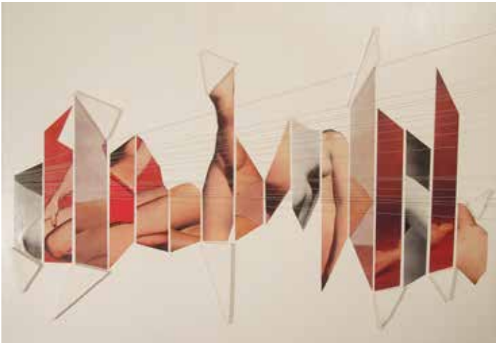
Claudia Huidobro, Collage 4, 2012

Claudia Huidobro n'hésite pas, elle aussi, à couper en tranches des corps de femmes pour former de surprenantes compositions où les morceaux de chair sont reliés par des fils dont le rythme renvoie à une partition musicale surréaliste. Avec les œuvres présentées, l'artiste use de différentes chromatiques : sépia, noir et blanc, couleurs saturées ou lavées renforçant la tonalité