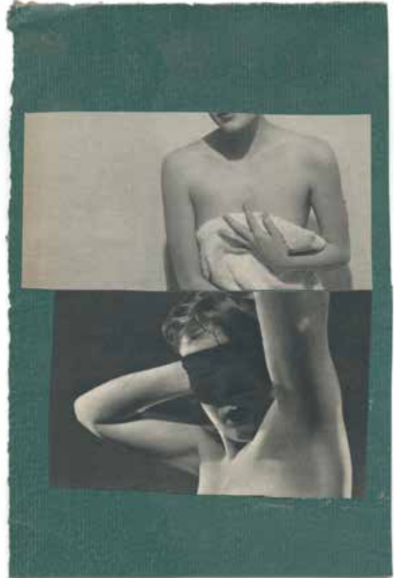
Katrien de Blauwer, Interior 11 , 2014