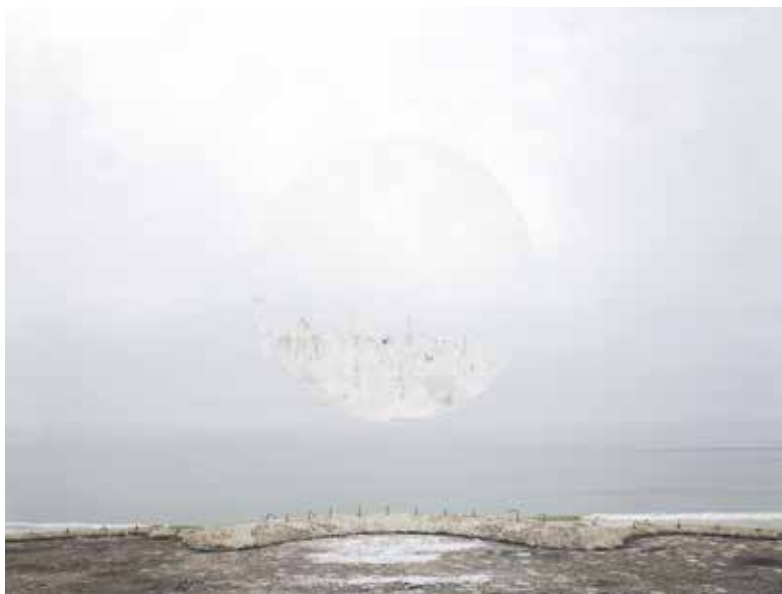
Southern Light Station VIII, IX, X, 2016, 168 x 223 cm