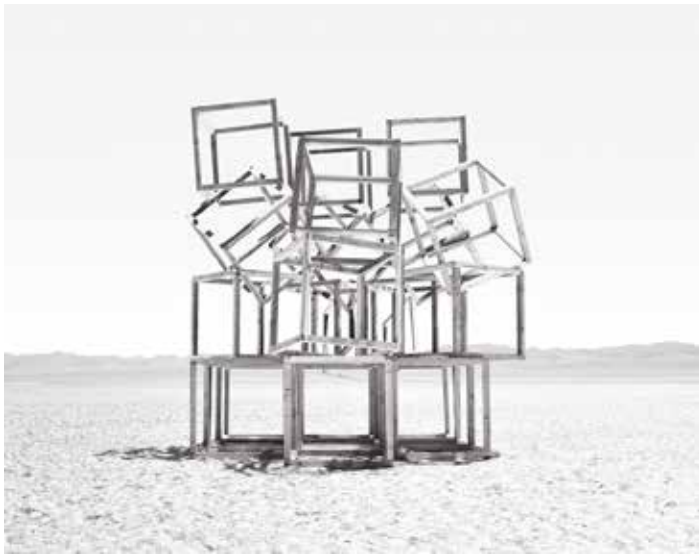
Telluris I, 2017, 168 x 223 cm

Dans son nouveau corpus, Telluris , l'artiste exploite les théories anciennes de la formation du relief de la terre, en particulier des montagnes, qui font écho aux théories de la voûte céleste. Elle s'intéresse particulièrement aux thèses de mathématisation et géométrisation radicale du paysage qui permettraient de mieux l'appréhender et le comprendre. En parallèle, la lecture du roman philosophique Le Mont analogue de René Daumal, dans lequel les héros partent à la