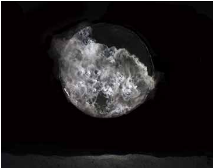
Southern Light Station VII, 2016, 168 x 214 cm

installations et sculptures qu'elle fabrique de toutes pièces et photographie in situ créant ainsi des « espaces autres », comme ceux décrit par le philosophe Michel Foucault. La réunion d'espaces fictionnels et d'espace géographiques fabrique des « hétérotopies », lieux concrets qui hébergent l'imaginaire.