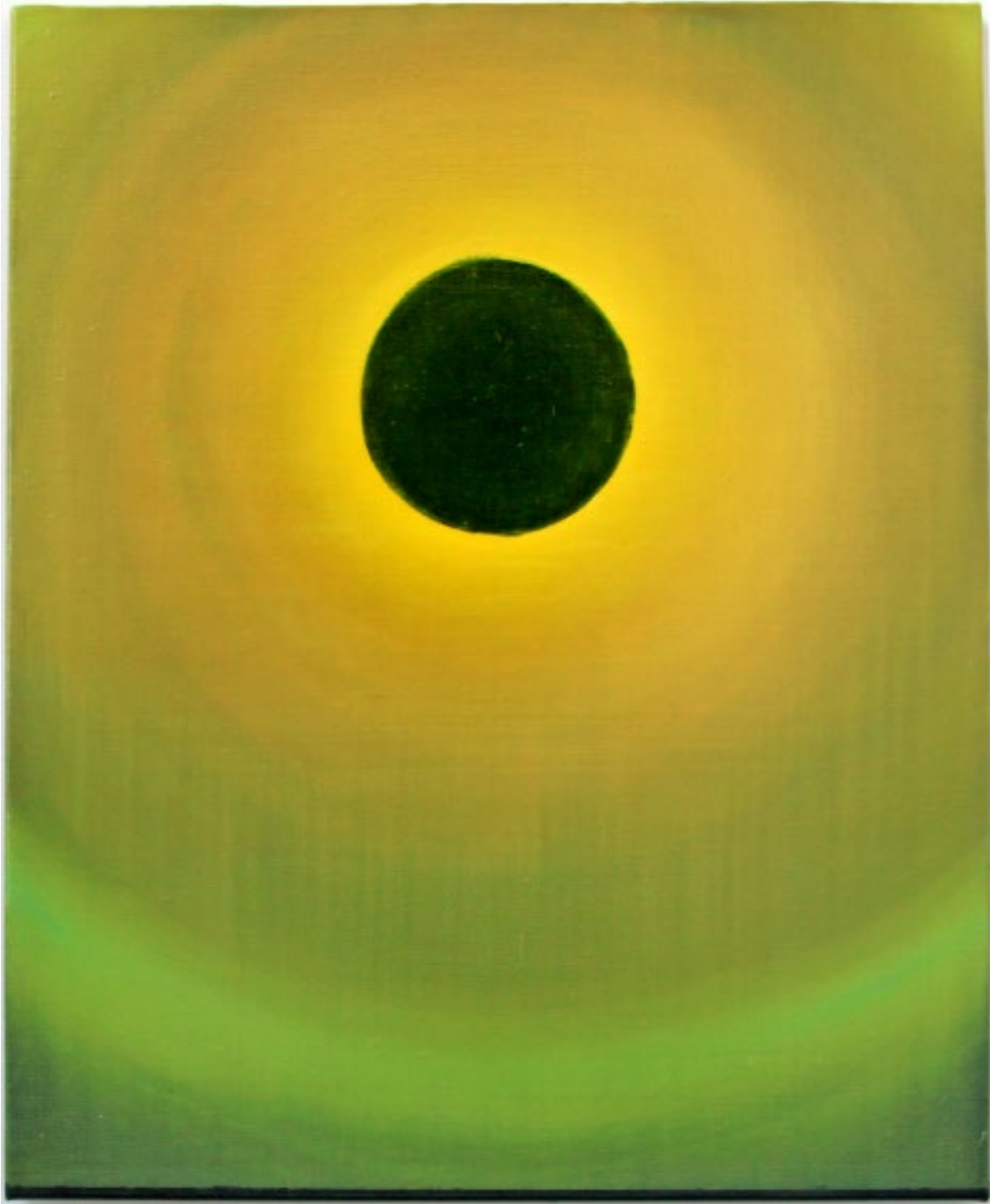
Eclipse , 2013. Acrylique et huile sur toile