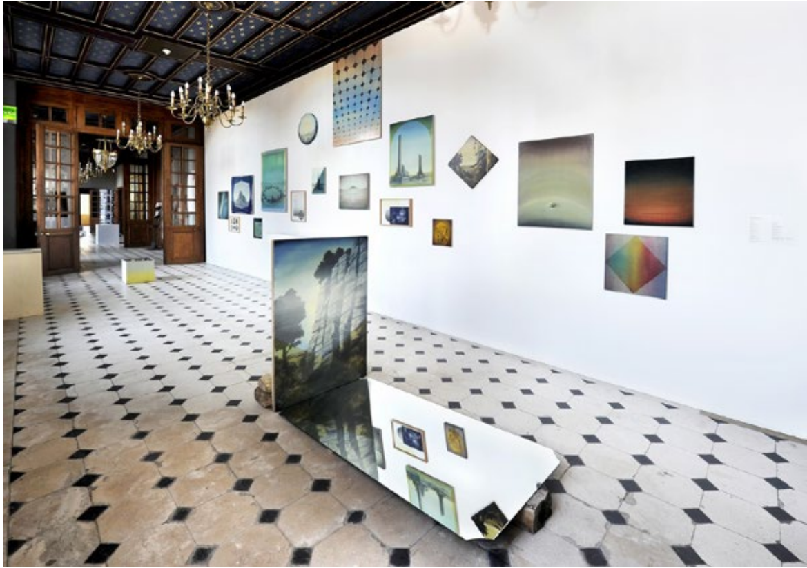
Vue d'exposition, «Vues» au Domaine de Chamarande, 2014