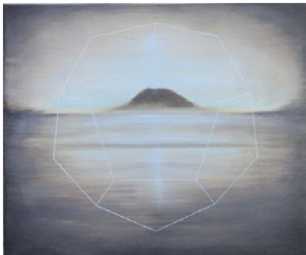
Mirage/dodécaèdre/élément ether Acrylique et huile sur toile 2012.

« Le premier contact avec l'œuvre d'Édouard Wolton est un vertige. Entre identité esthétique forte et motifs hétéroclites, entre délice plastique et démarche conceptuelle rigoureuse, entre hommage à la rationalité et dérive mystique, l'art oxymore de ce jeune peintre joue et se joue des contradictions inhérentes à la question de la représentation. Revendiquant la relation nécessaire de toutes ces oppositions, sa création navigue en eaux