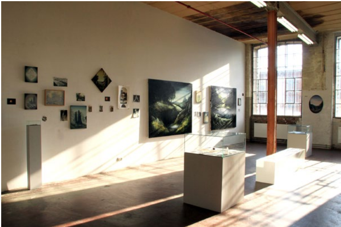
Vue d'exposition, «Geometrie der Natur» Spinnerei, Leipzig Allemagne, 2012