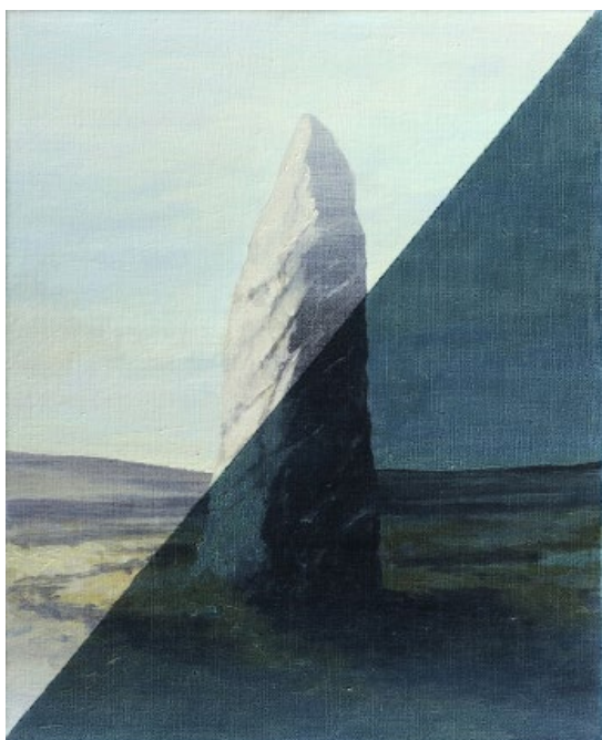
Menhir jour/nuite , 2013 Acrylique et huile sur toile

1 er vernissage le jeudi 3 septembre de 18h à 21h 2 nd vernissage le samedi 10 octobre de 15h à 20h