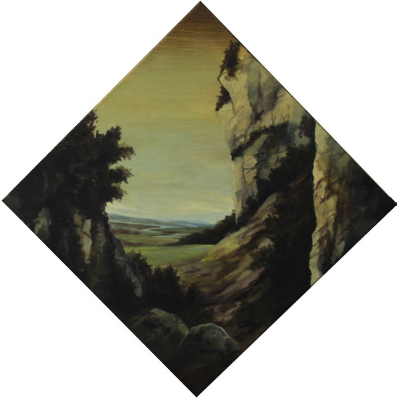
Carré italien , 2012. Acrylique et huile sur toile