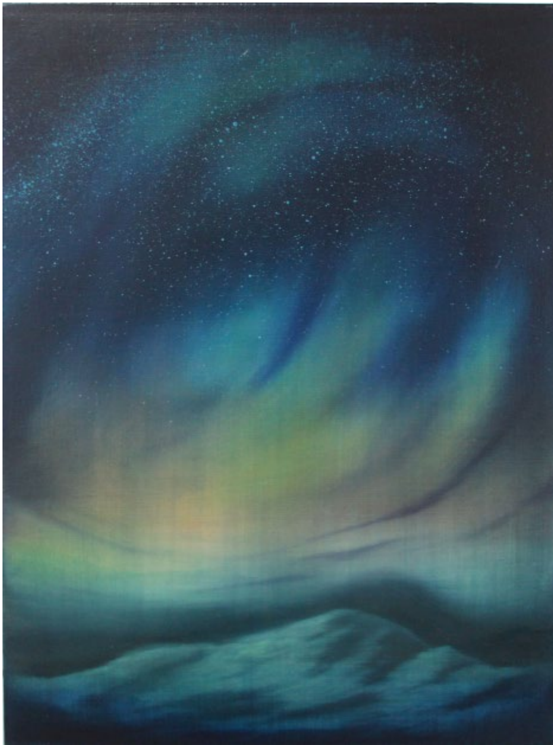
Aurore boréale , 2014 Acrylique et huile sur toile