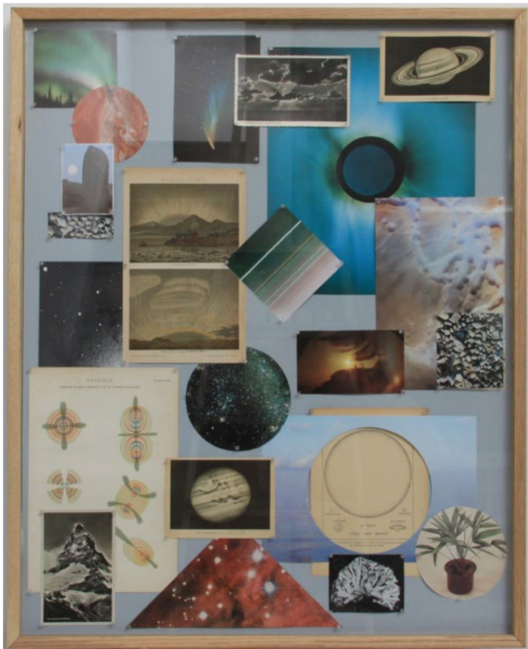
Bibliothécaire #3, 2013. Estampes, documents, photographies, épingles, sous cadre