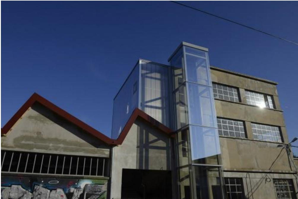
Le nouveau Transpalette

Après près de deux ans de fermeture pour cause de travaux, le centre d'art contemporain de Bourges, le Transpalette, se relance énergiquement avec une exposition, "Entropia", et des projets riches pour l'année à venir, centrés sur les questions post-identitaires.