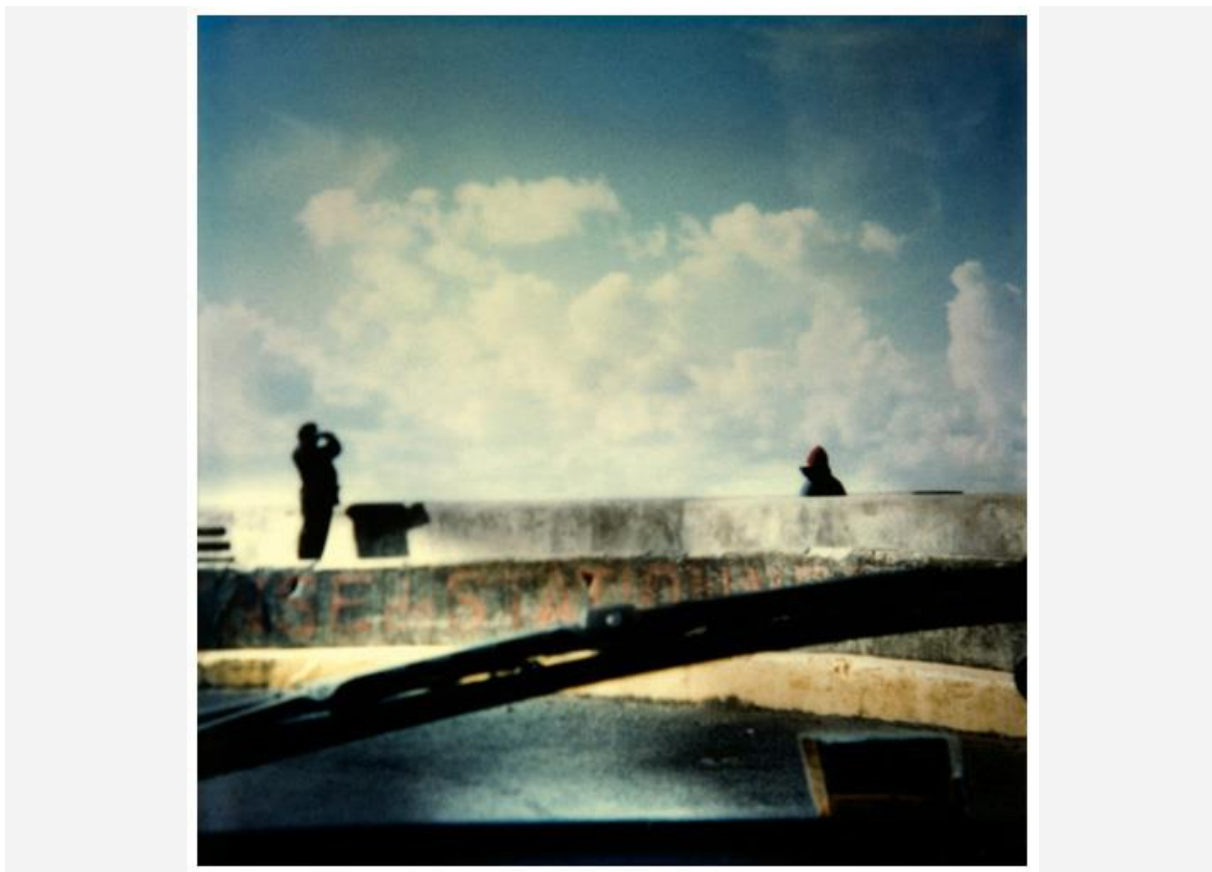
Polaroïd SX70 original #83 série Où commence le ciel ? 1995 – © Corinne Mercadier

L'espace photographique Leica du Faubourg Saint Honoré présente des Polaroids SX70 originaux de Corinne Mercadier, pour la plupart jamais exposés, ainsi que des dessins de la série Black Screen Drawings et un tirage de la série Solo.