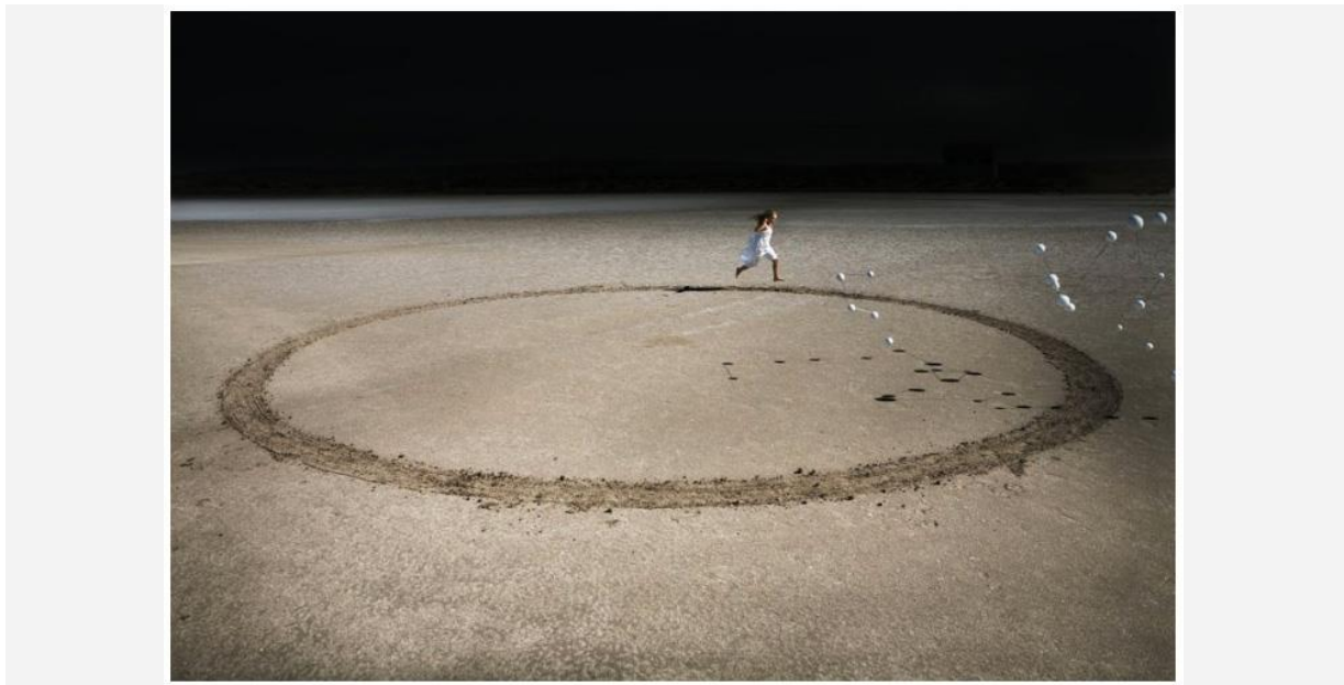
Demain - © Corinne Mercadier

La série Black Screen Drawings est constituée de délicats dessins au crayon de couleur qui concentrent en une surface miniature des rêveries sur l'espace.