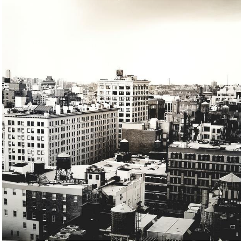
Vue de l'exposition Mitch Epstein à la galerie Les Filles du calvaire