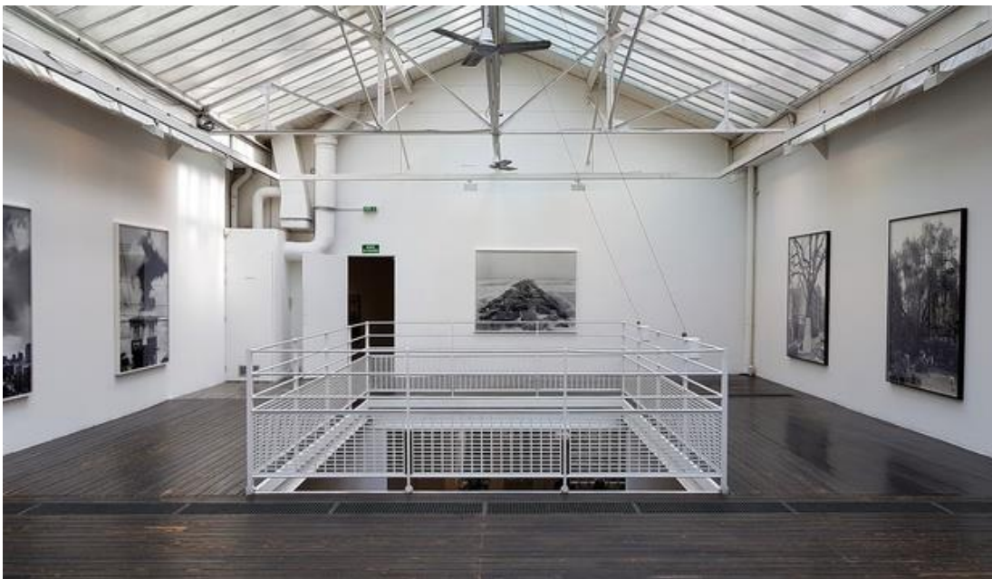
Vue de l'exposition Mitch Epstein à la galerie Les Filles du calvaire

À la manière d'un journal de bord visuel, nous vous proposons semaine après semaine de plonger en images au cœur des expositions franciliennes que nous avons visitées à la découverte des propositions artistiques les plus excitantes du moment.