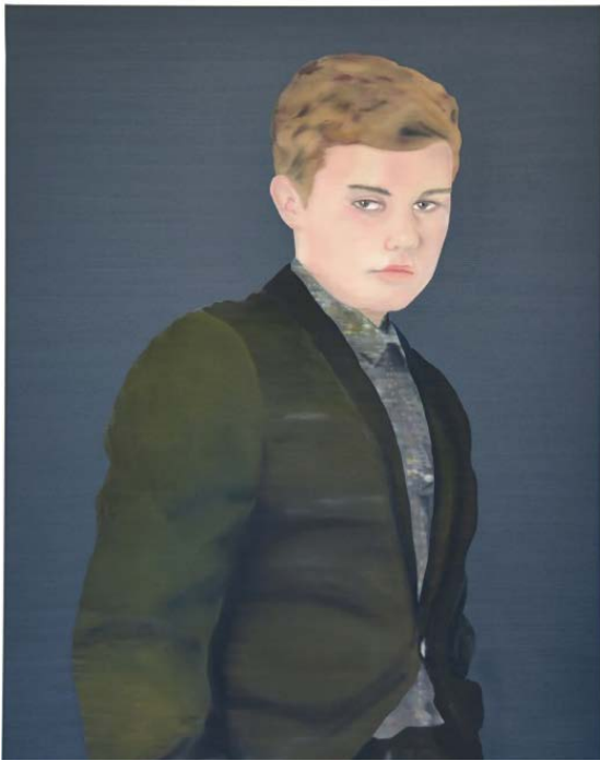
1216167, 2016, 160 x 120 cm

Exposition du 18 mars au 30 avril 2016 Vernissage le jeudi 17 mars de 18h à 21h