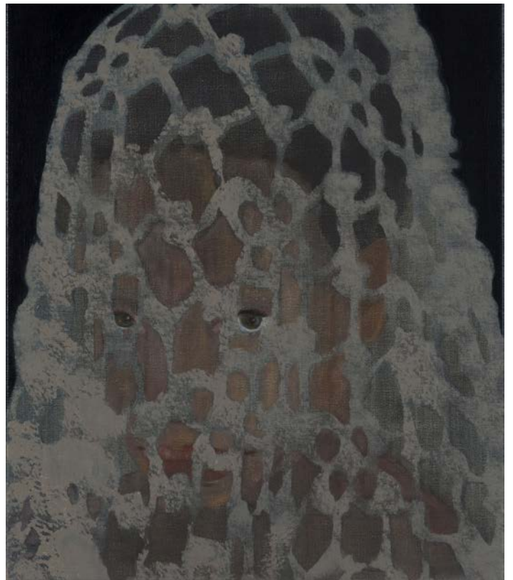
4050162, 2016, 40 x 50 cm