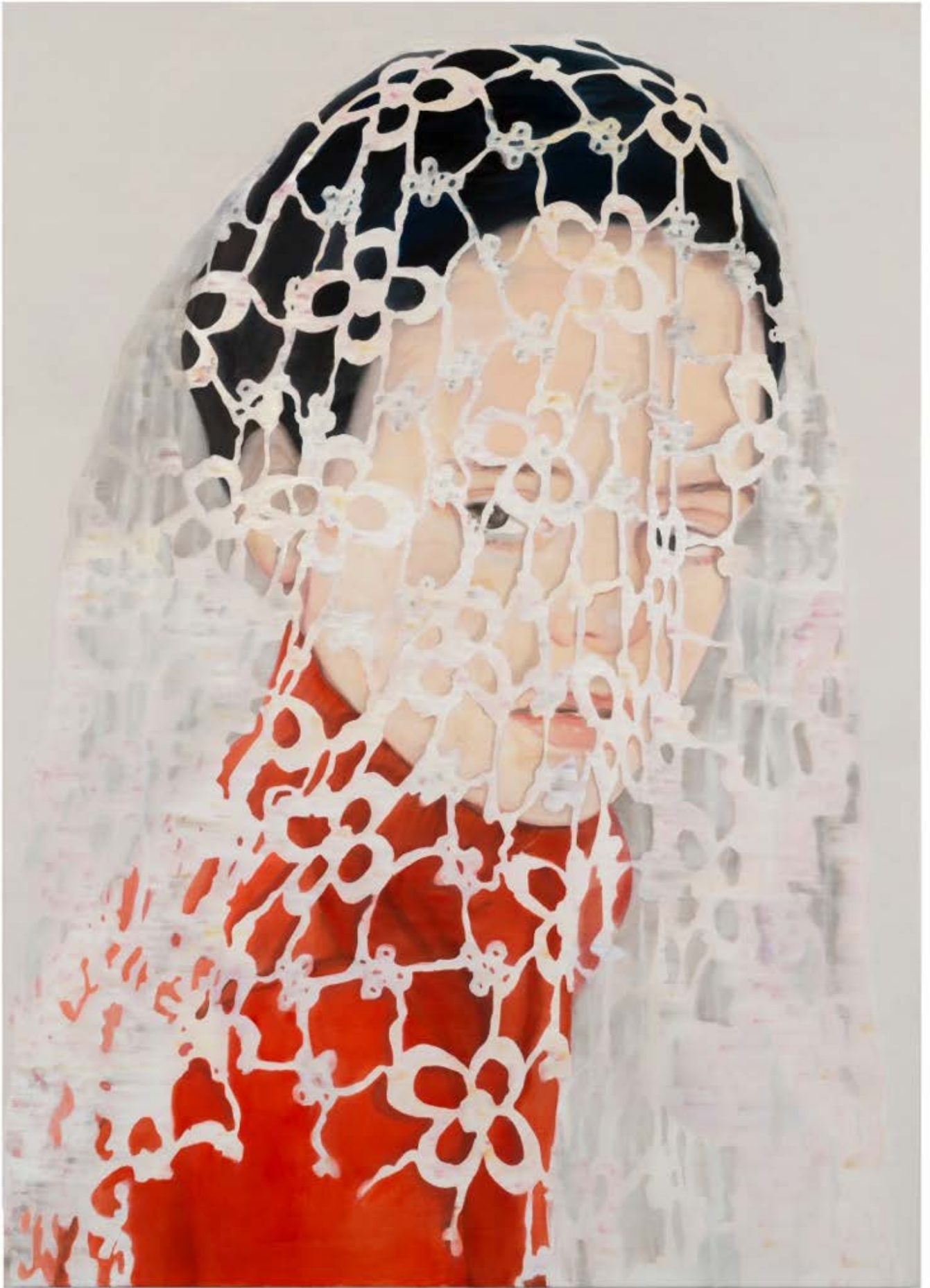
2100152, 2015, 210 x 150 cm