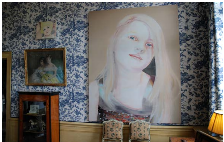
Vue d'exposition, Musée Van Loon, Amsterdam, 2014

Pour autant, les portraits de Katinka Lampe de la famille Van Loon sont résolument contemporains puisqu'ils représentent principalement, comme souvent dans son art, des jeunes personnes accoutrées avec habits et accessoires, tenant plus du fantasme et de la mascarade que du hiératisme protestant des portraits anciens. De même, Lampe joue à nouveau des codes séculaires de la posture du sujet en choisissant un cadrage détonnant, inspiré des photographies qu'elle réalise de ses modèles au moment de leur « mise en costume » dans des scènes orchestrées librement avec ses personnages. Les cadres, des gros plans la plupart du temps, renforcent souvent l'effet d'étrangeté et confèrent parfois au personnage un aspect grotesque, voire grimaçant, venant intensifier le décalage temporel provoqué par la perruque ou le masque qu'il arbore.