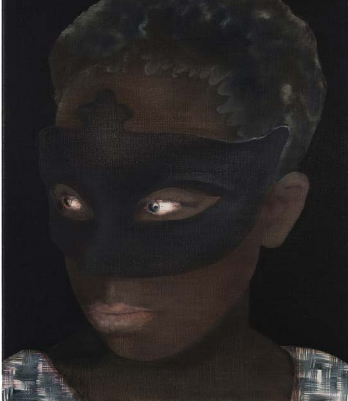
4050161, 2016, 40 x 50 cm