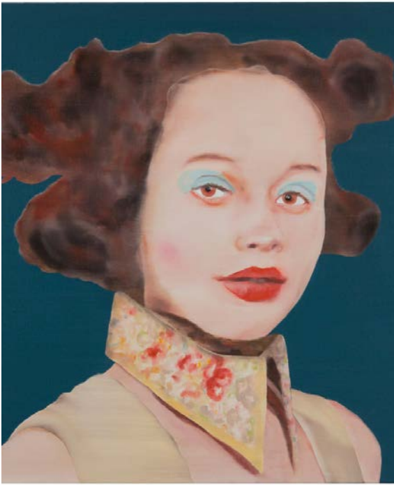
6065155, 2015, 65 x 60 cm

Dans un deuxième temps, Lampe s'inspire de ces images au moment de leur (mise en peinture), sans pour autant en faire des copies conformes. A la différence d'autres peintres contemporains, à l'instar de Gerard Richter, qui s'inspirent directement de la technique photographique, Katinka Lampe confère à la photographie un rôle d'incubateur qui permet autant aux modèles de se plonger dans un univers fantasmagorique et de libérer leurs énergies profondes qu'à l'artiste de capter leur singularité.