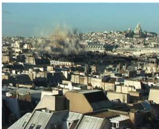
Semiconductor, The Sound of Microclimates , 2004