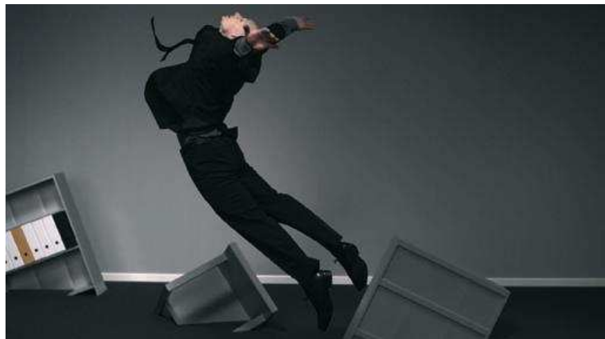
Clorinde Durand, Naufrage , 2008

Mihai Greco , Coagulate , 2008, 6mn / Clorinde Durand , Naufrage , 2008, 7mn / Enrique Ramirez , Brisés , 2008, 13m, / Amel El Kamel , Abena , 2008, 6mn / Bertrand Dezoteux , Le Corso , 2008, 14mn