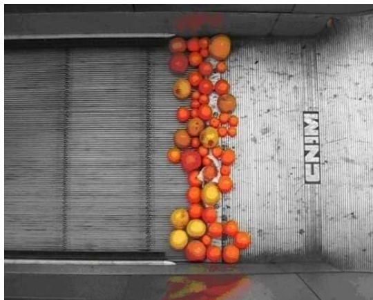
Jérémie LAFFON, « Symphonie 1 », 2005

En premier lieu, Vidéo Best Venues II , programme déjà présent l'année dernière. Chaque galerie participant au salon a été invitée à proposer une vidéo. Ainsi un programme d'une quarantaine de vidéos de qualité fut élaboré et était visible avant la foire sur internet et pendant le salon en continu. Pendant la foire le public, composé de professionnels et collectionneurs, était invité à sélectionner et à désigner les huit meilleures vidéos présentées dans cette programmation. Cette sélection constitue le programme Vidéo Best Venues que nous présenterons à la galerie. Le programme Vidéo Best Venues I a été présenté en 2008 dans des institutions telles Le Cube et des salons d'art contemporain comme NEXT à Chicago.