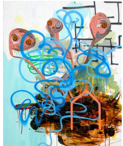
Rhizome sweet home , 2008-2009, Technique mixte sur toile, 170 x 140 cm