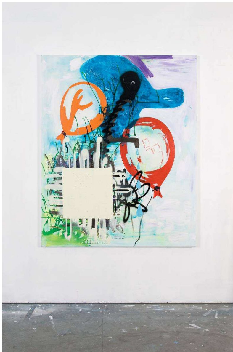
Mes Deux Ballons , 170 x 140 cm, technique mixte sur toile, 2009

Exposition du 28 novembre 2009 au 16 janvier 2010 Vernissage le samedi 28 novembre de 15h à 21h