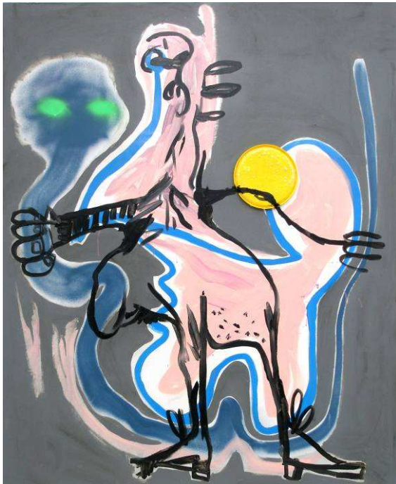
Kraken contre Kraken , 170 x140 cm, techniques mixtes sur toile, 2006