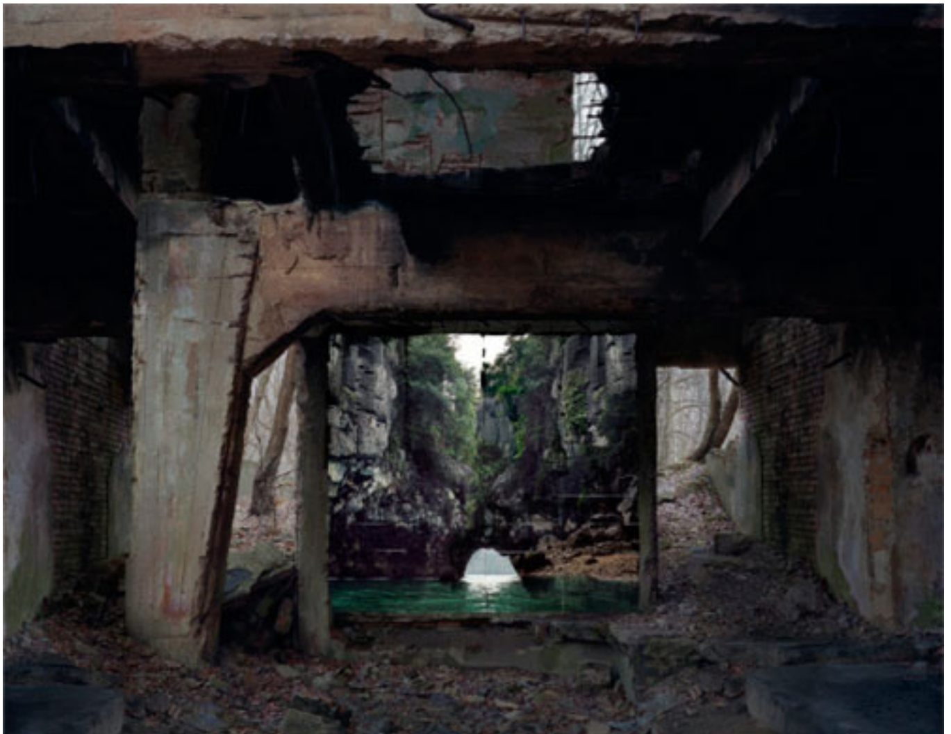
Réservoir , Série Haven her body was , 2012, 165 x 208 cm