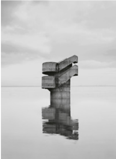
Observatoire III, Série The Geometrical determination of the Sunrise , 2013, 60 x 48 cm

photographie stéréoscopique. « J'ai construit des stéréoscopes avec des images que j'ai composées moi-même en numérique et non pas avec un appareil photo stéréoscopique habituel. Donc l'effet 3D n'apparaît que sur une seule partie de l'image ». Superposer les images, en fragmenter les points de vue, élaborer de nouvelles perspectives figurent au centre des préoccupations de Noémie Goudal.