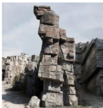
Stereoscope, plate VI, 2012, 6 x 13 cm