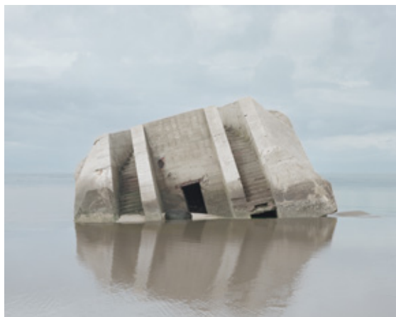
Combat, Série A Walk on the wild side, 2012, 111 x 113 cm

Il est donc à nouveau question de superpositions de plans et de fragmentations d'espaces pour créer de nouvelles perceptions, en jouant sur les perspectives du lieu d'accueil (grottes, usines désaffectées, navires échoués, granges abandonnées) et des traces laissées par son histoire. Des sites sans perspective au départ se voient ainsi prolongés et transformés en un autre décor naturel ou industriel, grâce à cette superposition d'images. Il n'y a