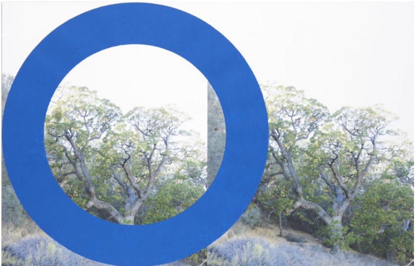
(BLUE), 2013, peinture acrylique, impression jet d'encre sur toile, 142 x 224 cm