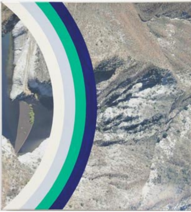
CONFORMED, 2014, peinture acrylique, impression jet d'encre sur toile 54 x 50cm