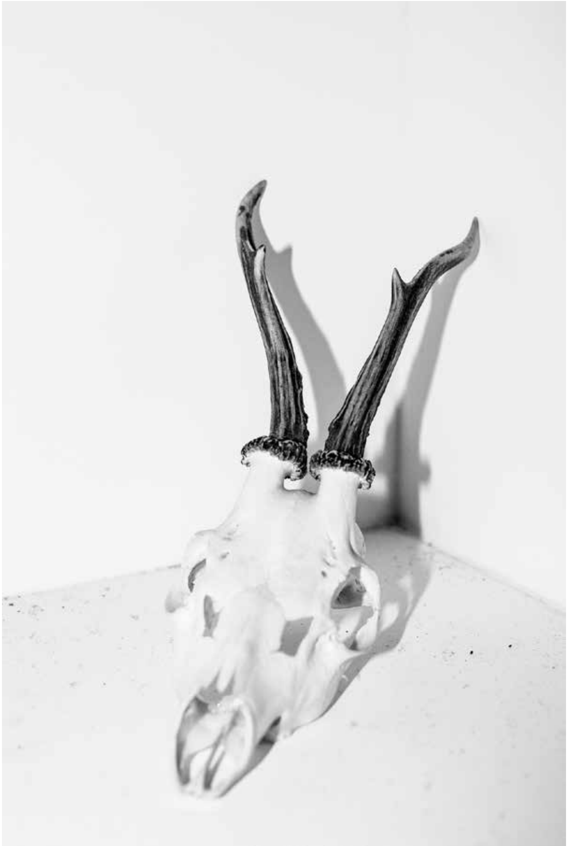
Shrinky Recipe , 2019 From series Testing Virgins, On Rape