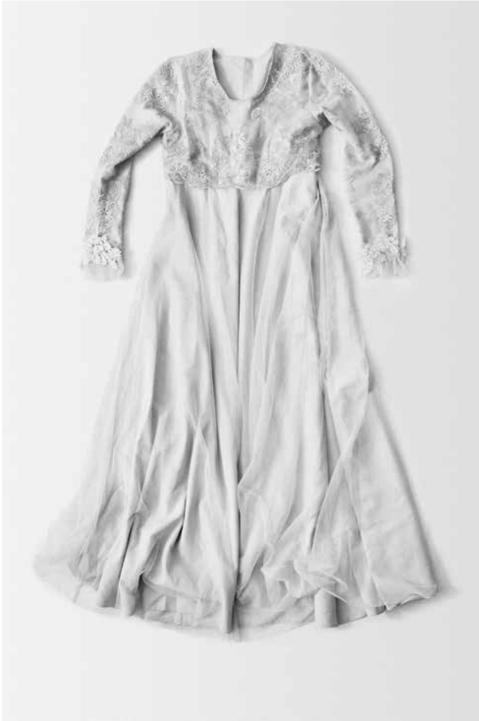
Ala Kachuu, [Bride Kidnapping], Kyrgyzstan, 2019 From series Power Rape, On Rape

I saw my husband for the first time on my wedding day. His friends drove me to him. I thought I wasn't going to be able to handle it as I was furious with him, I loved another man and dreamed of becoming his wife. Instead I was forced to marry the man who had kidnapped me. At first, when I confronted him he was silent, then he apologised. My sister had also been taken in the past but had run away. My religious ceremony [Nike] was organised very quickly and officially registered immediately so that I couldn't withdraw from it. Before that, I was a 21 year old student in my fourth year at Arabaev University. I wanted to be a fashion designer. During the holidays I went to visit my family as I didn't want to stay alone in the residency, fearing I might suffer the same fate as my sister; so I travelled on New Year's Eve. I remember happily baking the day before, then I went to visit my sister and on the way home I was ravished. When my family arrived at the kidnapper's home, my mother wanted to bring me back but my grandmother asked me not to disgrace my family, especially after my sister had run away and people in the village had talked about it for a long time. I began crying, but my grandmother begged me to stay there. So I did.