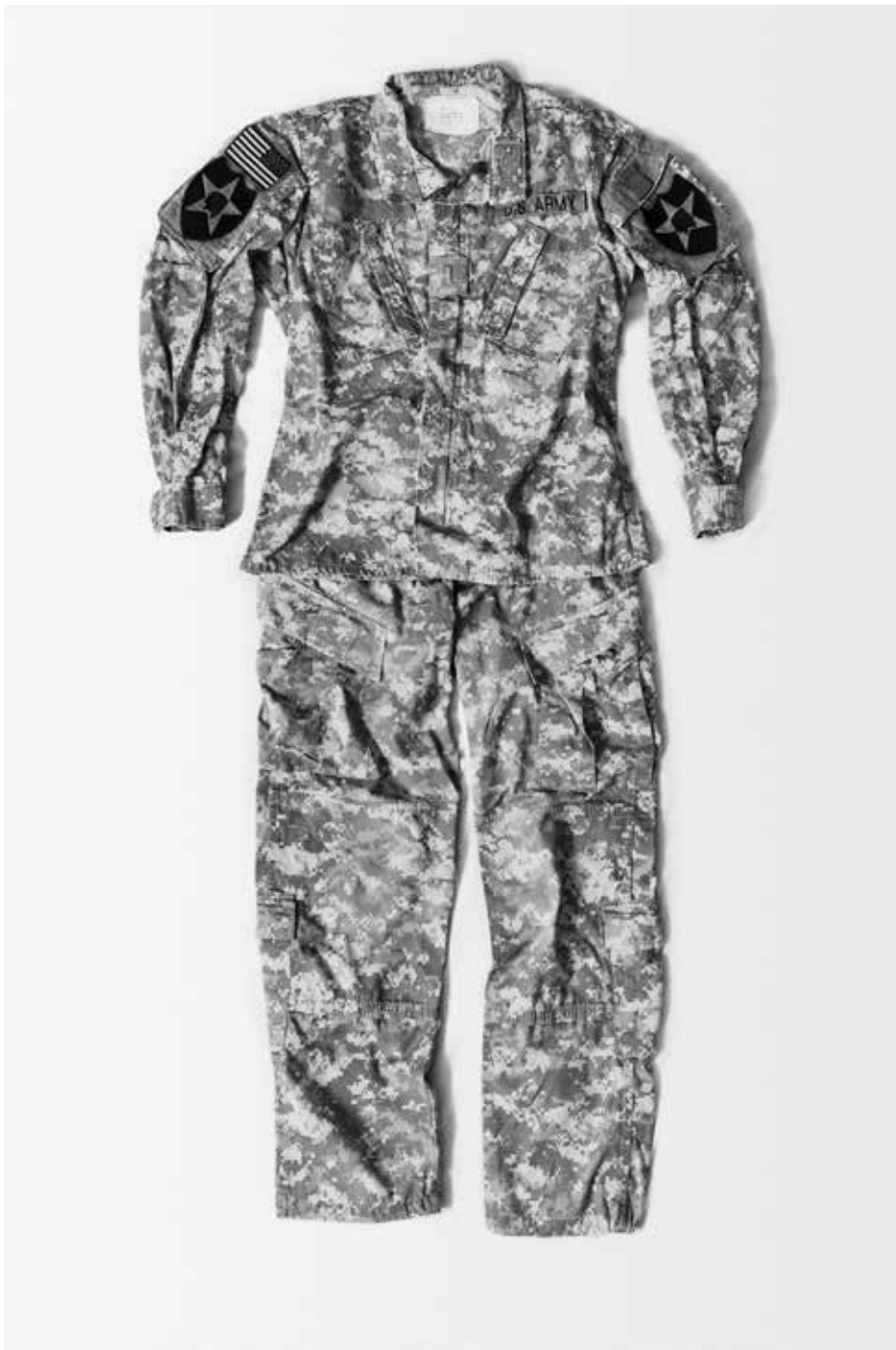
Militar Rape, US, 2019 From series Power Rape, On Rape

In the military everything we do is "mission first". Women in the force are seen as weak and emotional, a liability. We constantly downplay our injuries and refuse to be a victim. Before I really came to terms with the fact I had been raped, I had only shared small parts of my story. Eventually I told my boyfriend what my commander had done to me and when I saw the tears and pain in his eyes, I finally understood something really bad had happened. I was still struggling with identifying myself as a rape victim - it didn't seem like a fair title to claim for myself - when he was arrested, discharged but set free after a new case. I grieved for the young girl and I hated myself for not reporting him years earlier. He was indeed a rapist. However, the first time I told my story publicly was years later at an all-women veteran's retreat. I could feel it bubbling up inside me, so I tearfully shared the "relationship" I'd had with my commander, still unable to see how severely he had manipulated me into [a year of] sexual subservience. It was a terrifying relief to finally speak aloud the shame that had festered inside me for so long. But what really set me free was when one of the female leaders looked me in the eye and told me that it was not my fault.