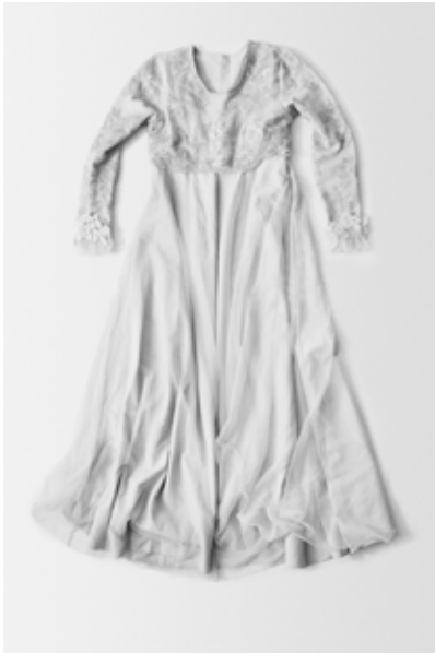
Ala Kachuu , [Bride Kidnapping], Kyrgyzstan, 2019 From series Power Rape, On Rape

La publication est fixée à trois images maximum. Pour plus, contactez Catherine Philippot (Relations Media)