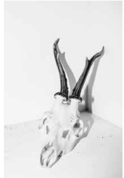
Shrinky Recipe , 2019 From series Testing Virgins, On Rape