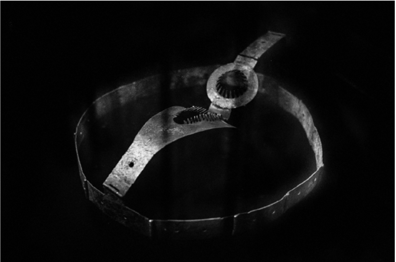
Chastity Belt, 2019 From series Historical Rape, On Rape