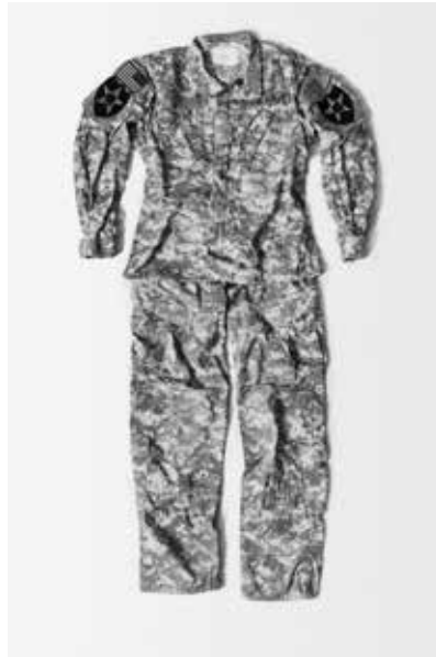
Militar Rape , US, 2019 From series Power Rape, On Rape