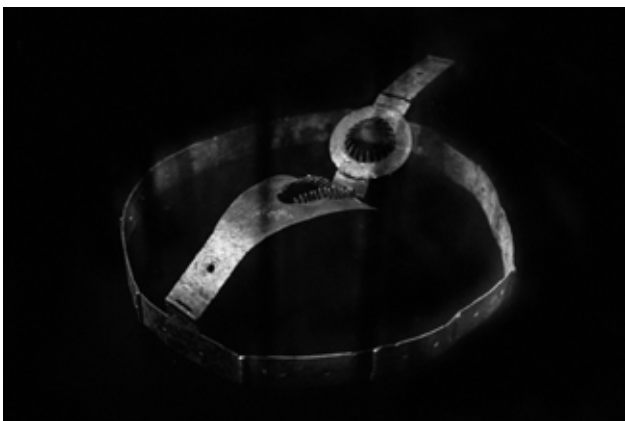
Chastity Belt , 2019 From series Historical Rape, On Rape