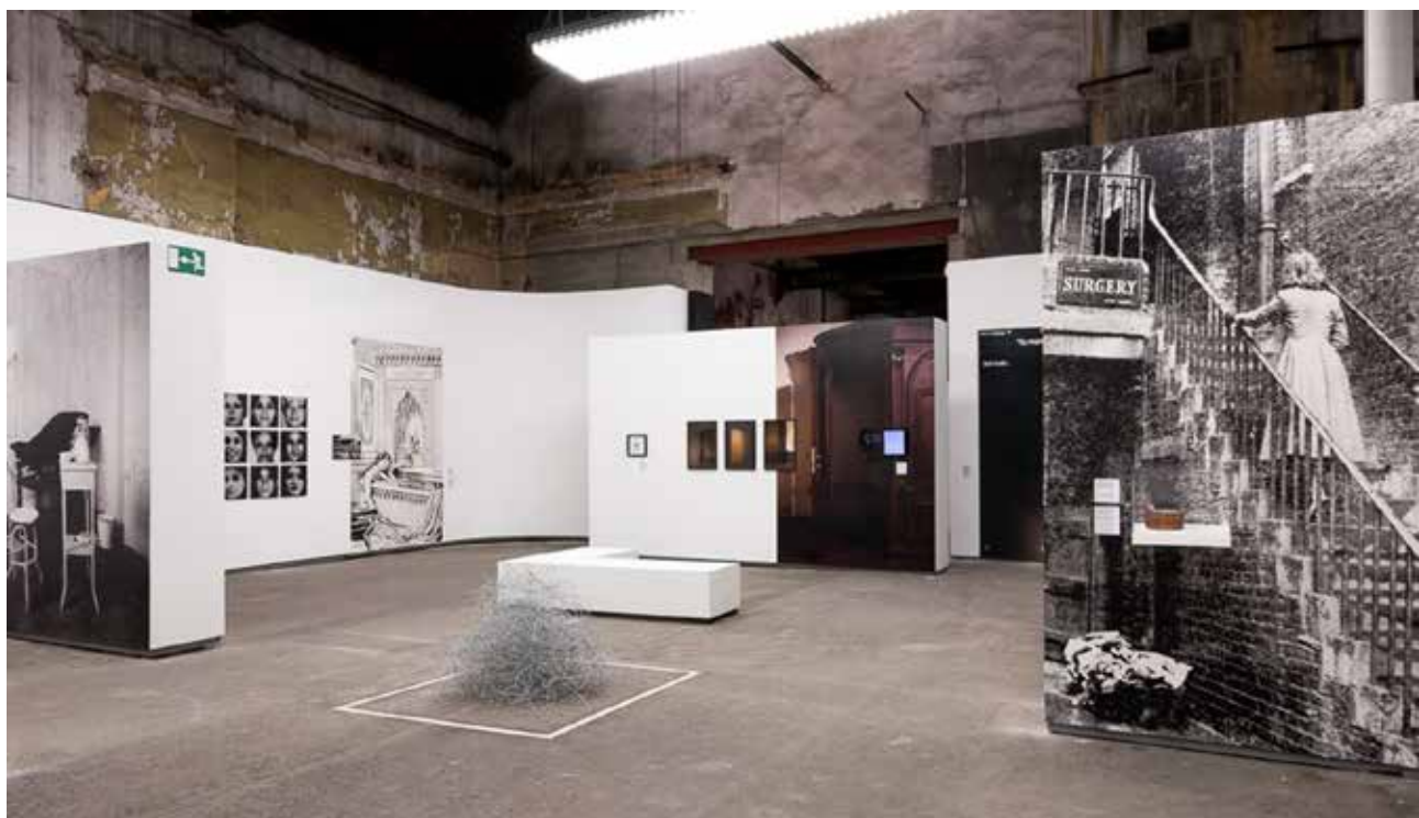
On Abortion , Les Rencontres d'Arles, 2016

L'exposition a été présentée dans plus de 10 pays, notamment à la Photographers Gallery (Londres), le Musée d'art contemporain (Zagreb) et le Centro de la Imagen (Mexique). Le livre On Abortion and the repercussions of lack of access (Dewi Lewis, 2018) a reçu le prix du meilleur livre Aperture en 2018 et a été finaliste du prestigieux Deutsche Borse Prize en 2019.