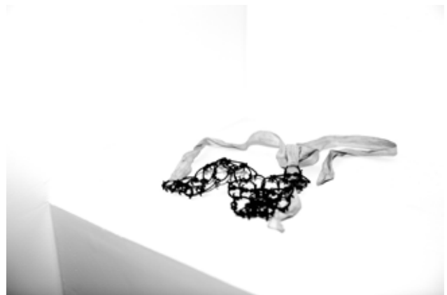
Cilicio , 2019 From series Punishment, On Rape