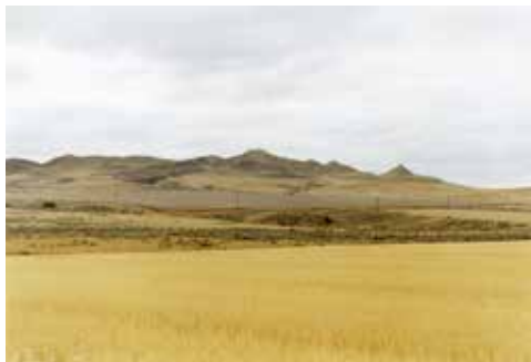
Thibaut Cuisset Wyoming , Etats-Unis, 2012