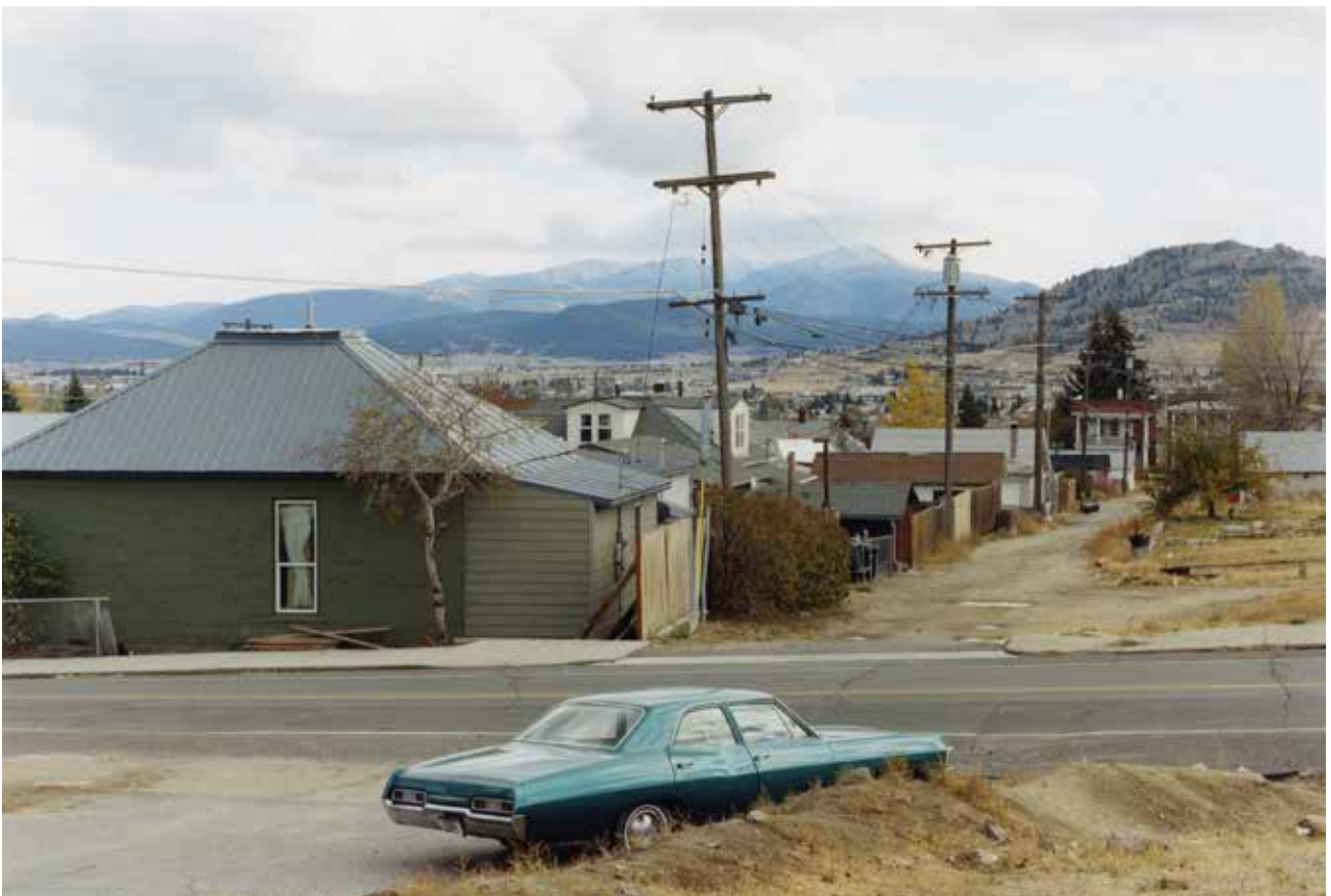
Thibaut Cuisset Montana, Etats-Unis, 2012