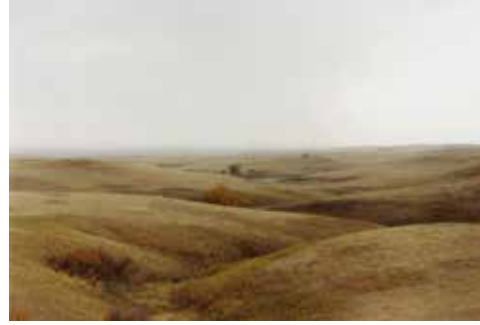
Thibaut Cuisset Dakota du sud , Etats-Unis, 2012