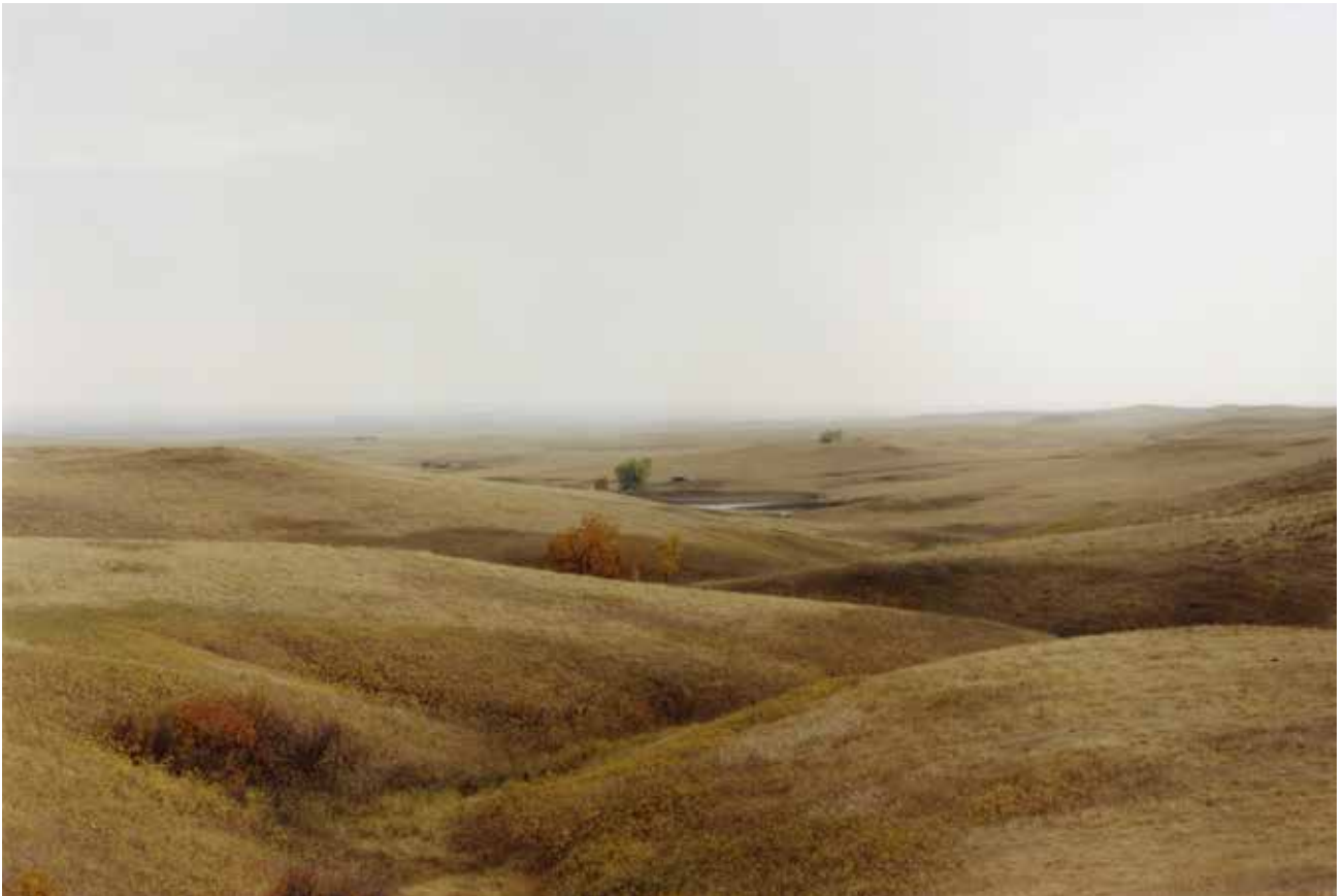
Thibaut Cuisset Dakota du sud , Etats-Unis, 2012