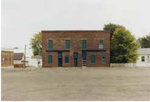
Thibaut Cuisset Dakota du sud , Etats-Unis, 2012