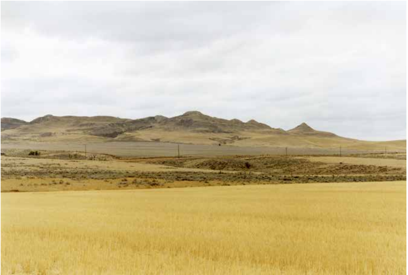
Thibaut Cuisset Wyoming, Etats-Unis, 2012 Courtesy Galerie Les filles du calvaire