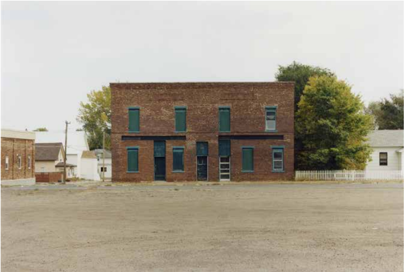
Thibaut Cuisset Dakota du sud , Etats-Unis, 2012