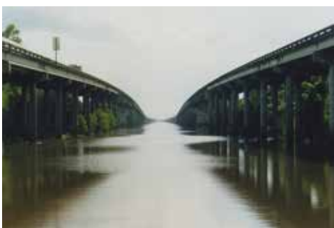
Thibaut Cuisset Louisiane, Etats-Unis, 2014 Courtesy Galerie Les filles du calvaire © ADAGP, Paris, 2021