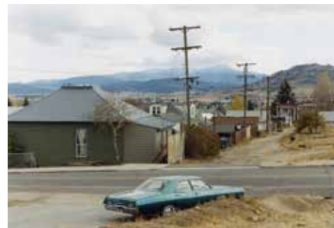
Thibaut Cuisset Montana, Etats-Unis, 2012 Courtesy Galerie Les filles du calvaire © ADAGP, Paris, 2021