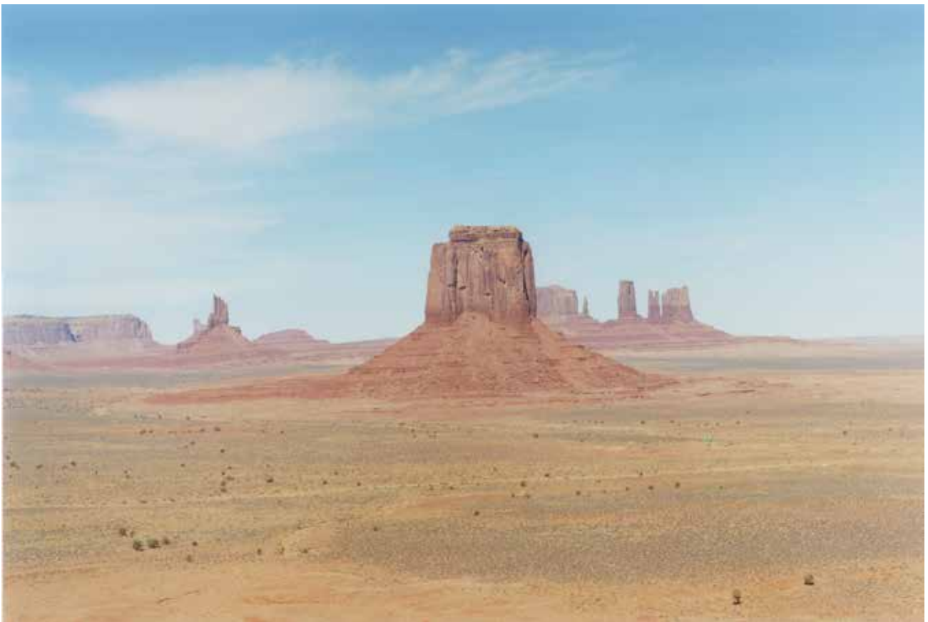
Thibaut Cuisset Arizona, Etats-Unis, 2012 Courtesy Galerie Les filles du calvaire © ADAGP, Paris, 2021