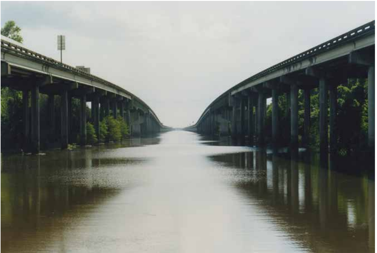
Thibaut Cuisset Louisiane, Etats-Unis, 2014 Courtesy Galerie Les filles du calvaire © ADAGP, Paris, 2021