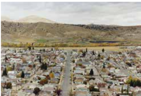
Thibaut Cuisset Montana, Etats-Unis, 2012