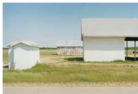
Thibaut Cuisset Mississippi, Etats-Unis, 2014 Courtesy Galerie Les filles du calvaire © ADAGP, Paris, 2021