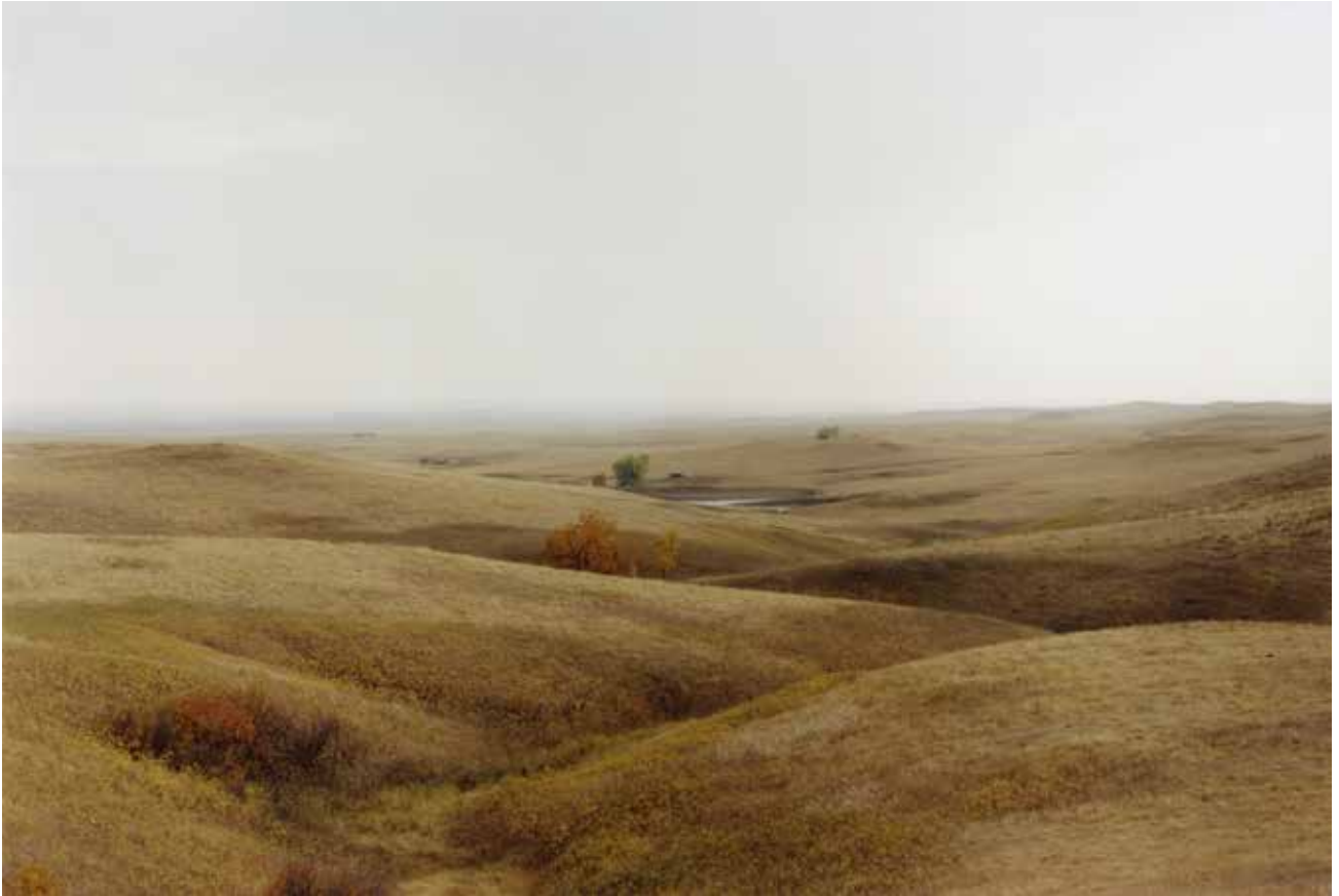
Thibaut Cuisset Dakota du sud , Etats-Unis, 2012 Courtesy Galerie Les filles du calvaire © ADAGP, Paris, 2021