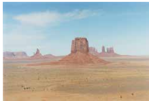
Thibaut Cuisset Arizona, Etats-Unis, 2012 Courtesy Galerie Les filles du calvaire © ADAGP, Paris, 2021